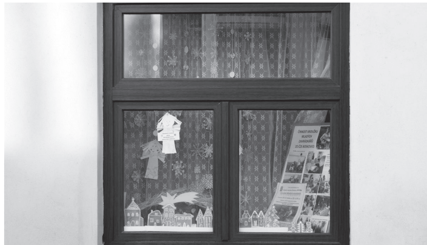
Děti z boskovické MŠ, pracoviště Lidická, se spolu s paními učitelkami postaraly o letošní vánoční výzdobu jednoho z oken prodejny zahrádkářských potřeb a přebytů patřící Českému zahrádkářskému svazu v Boskovicích.

V posledních řadě nemocnice zakoupila jednačtyřicet nových elektrických polohovacích postelí za 1,5 milionu korun. Polovina z nich poputuje na různá oddělení, kde je třeba vyměnit původní lůžka, polovina je určena pro rozšíření rehabilitačního oddělení, které je naplánováno na začátek příštího roku. Radim Hruška