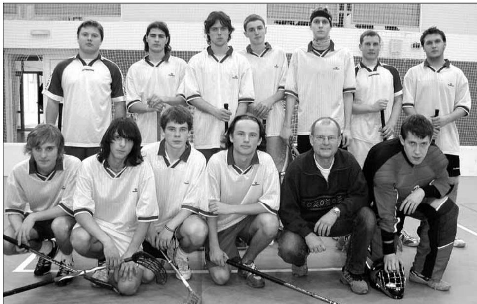
Přeborník. Titul na okresním přeboru středních škol získal tým SOŠ a SOU MŠP Letovice.