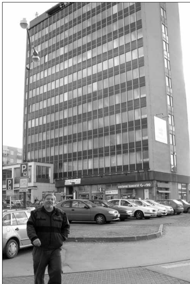
Prodáno. Výšková budova v centru Blanska má od minulého týdne nového majitele.

Vítězný projekt byl podle vedení města velmi koncepčně a detailně připraven. „Důležité bylo mimo jiné, že řeší problém