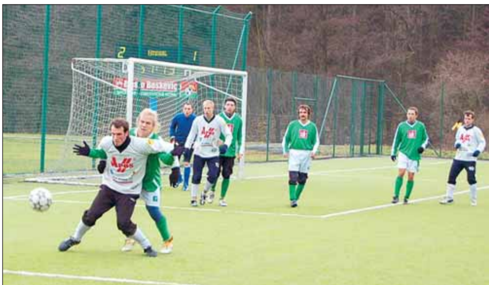
Urputná obrana. Jako k bojovému tanci jako novozélandští ragbisté vykročili fotbalisté Blanska a Jesence při rohovém kopu.

FK Apos Blansko - SK Jesenec 5:1 (0:1) , Němec 2, Čejka, Příkryl, Bednář. Blansko (1. poločas): Švancara - Kugler, Klimeš, Koutný, Bednář - Rychnovský, Pospíšil, Štrajt, Šenk - Svoboda, Pernica. Blansko (2. poločas): Slanina - Němec, Kugler, Škvarenina, Koutný - Příkryl, Kleveta, Bednář, Šíp - Sehnal, Čejka. Utkání dvou různých poločasů – nejen sestavami. V prvním dal trenér Vašíček šanci především omladině, zkoušel i Pospíšila z Lipůvky. Ukázalo se, že v až tak obměněném složení by to nešlo. Soupeř šel do vedení v 16. minutě po standardní situaci z malého vápna, která připomněla podobnou situaci z minulého týdne. Mladíci se snažili o zvrát – jako první vyzkoušel soupeřova brankáře Kugler. Jesenec