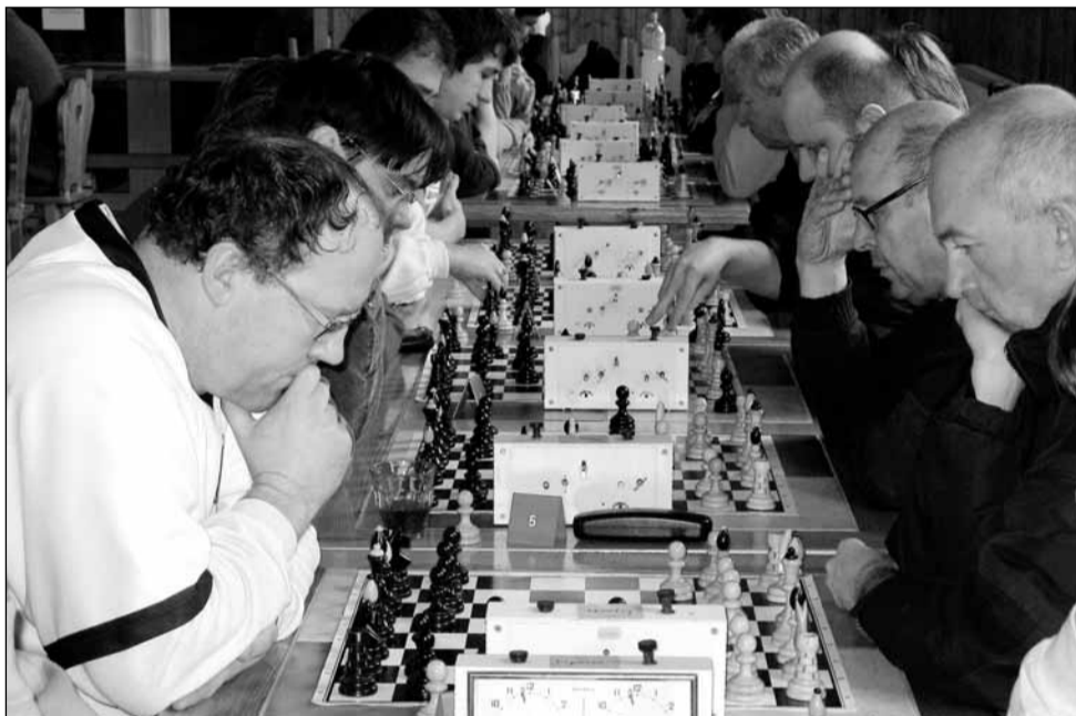
Soustředění. Lipovecká sokolovna hostila 12. ročník okresního šachového turnaje.

KP junioři: Velké Meziříčí – Blansko 3:4 (1:1, 1:2, 1:1) , Vystrčil, Hartman, Bažant, Bílý O. (pš, bh)