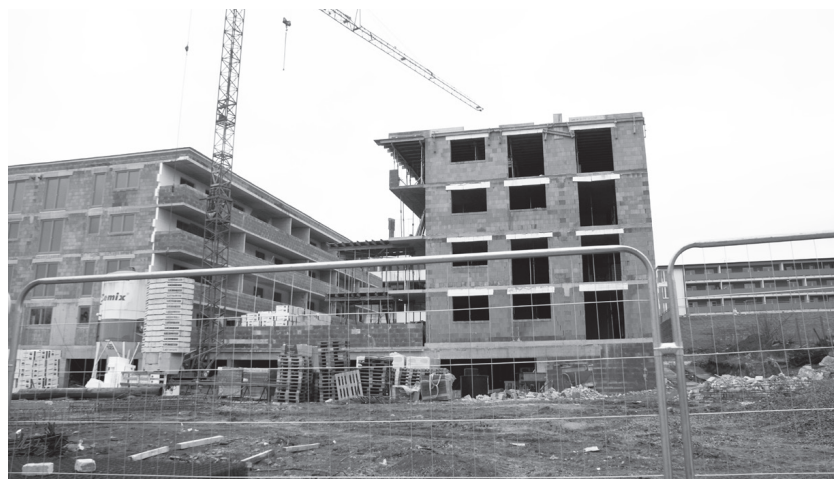
Bytová výstavba v lokalitě Výsluní v Boskovcích pokračuje.