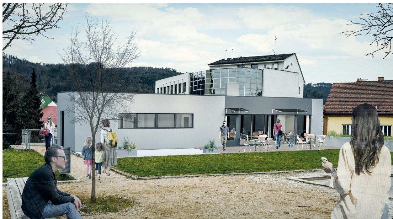
Vizualizace kavárny. Více na straně 4.