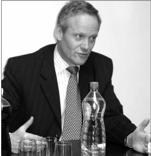
Ministr. Cyril Svoboda ve Viskách besedoval se starosty.

Kinoautomat v Boskovicích. V sobotu 16. února zavítá do Boskovic Kinoautomat. Představení Člověk a jeho dům se bude v kině Panorama promítat v 17 a 20 hodin. Multimediální projekt Kinoautomat filmového režiséra a technologického vizionáře Raduže Činčery se v plné funkčnosti vrací po čtyřiceti letech. Film se vždy v určitém napínavém momentě zastaví, na jevišti před plátno vyjde moderátor a vyzve diváky, aby pomocí dvou tlačítek rozhodli, jak bude příběh dále pokračovat. Film je pojat jako situační komedie a jeho zápletka se točí okolo obyvatel jednoho činžovního domu. (hrr)