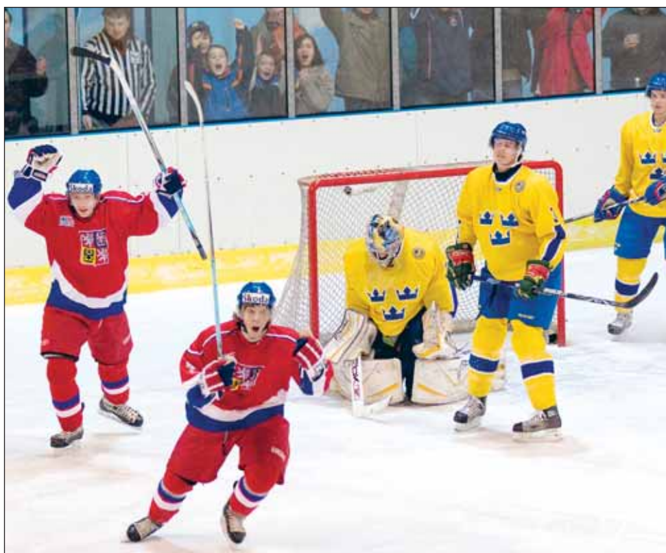
Góóól. Čeští mladíci se takto radovali v Blansku dvakrát.