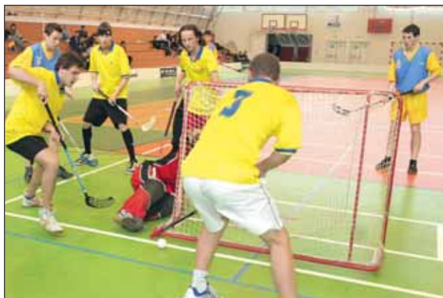
Boj. Letovičtí škola dosáhla na krajské třetí místo.

Na krajském finále dívek ve Znojmě pak skvělého úspěchu dosáhly florbalistky boskovického gymnázia, když bez porážky zvítězily. (bh)