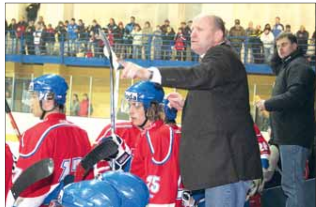
Plný dům. Svěření trenéra Čecha přišla podpořit do Blanska rekordní návštěva.

Hráli jsme dobře dozadu, plnili jsme taktické pokyny a navíc jsme dali branky. (pš)