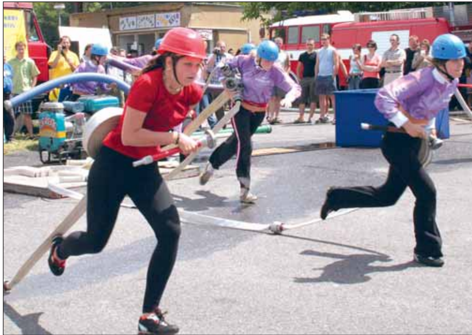
Na trati. Hasiči se v letošním roce utkají také v Senetářově.

Snaha o zkvalitnění soutěže se podařila. Již v prvním roce jsme získali silného „společníka“, kterým je až do současnosti Pivovar Černá Hora. Ten celou soutěž zajišťuje jako oficiální partner. I prezentace v novinách se zlepšila. Během let jsme se snažili oslo-