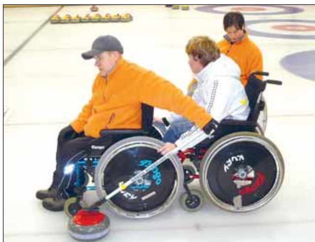
Štouch. Curling patří mezi handicapovanými k velmi populárním sportům.

Sportovní klub Kociánka Brno, o. s. je organizace, která zajišťuje sportovní činnost dětí a dospělých s tělesným postižením převážně spastickým. Spolupracuje jak s ÚSP pro tělesně postiženou mládež Kociánka, tak s handicapovanými sportovci a organizacemi celé české republiky. SKK Brno je členem České federace Spastic Handicap, o. s., která sdružuje tělovýchovné jednoty a sportovní kluby z celé České republiky. Jeho sportovci tak získávají možnost jezdit na závody a měřit si síly s ostatními zdravotně postiženými. V případě dobrých výsledků má sportovec možnost se zúčastňovat i mezinárodních akcí.