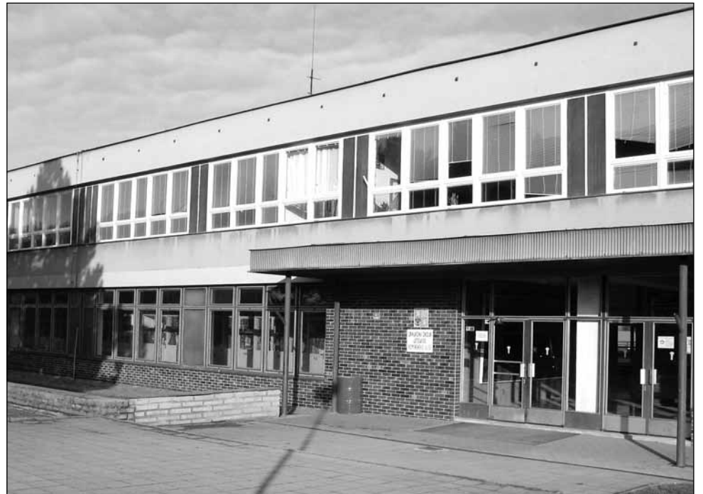
Úspory. Do zateplení školského zařízení se díky dotaci pusť také v Letovicích.

Podle něj by mohli případné úspory dosáhnout až dvou třetin současných nákladů. „Plášť budovy totiž dostane patnácticentimetrovou vrstvu polystyrenu, strop pod střechou dvaceticentimetrovou a sklep deseticen-