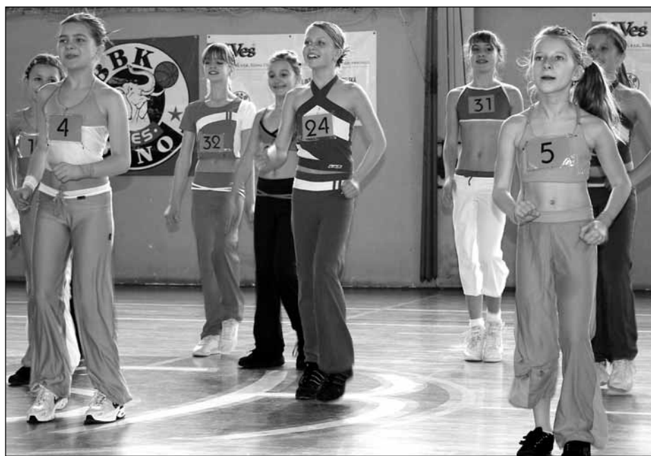
Akce. Více než sto účastníků se představilo minulý týden v hale ASK Blansko na dvanáctém ročníku soutěže Aerobik mladých. Výsledky všech pěti kategorií najdete na str. 9.