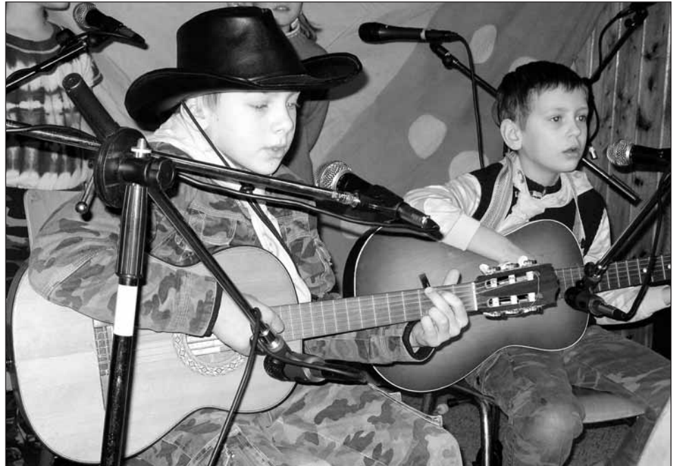
Vystoupení. Ukázat své umění přijelo do Doubravice dvanáct kapel.

Jednou z kapel, které jezdí na Dětskou portu pravidelně, jsou i Kopretiny. Tři čtrnáctileté dívky spolu hrají už pátým rokem. Původně sice byly čtyři, ale jedna členka už přesáhla věkovou hranici dětské soutěže.