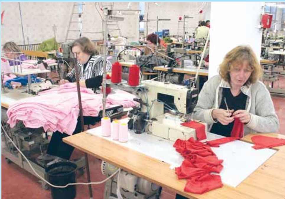
Novou pracovní příležitostí našly v Boskovicích ženy ve firmě Pleas, a. s.