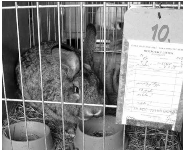
Pro chovatele. Výstavu v olešnickém areálu chovatelů ovládli králíci.

„Jde nám především o to, aby si zájemci z řad nečlenů svazu koupili kvalitní zvířata do svých chovů. Jen jako ukázkou jsme měli několik voliér drůbeže, protože v současné době na to není prostor. Drůbež vystavuje-