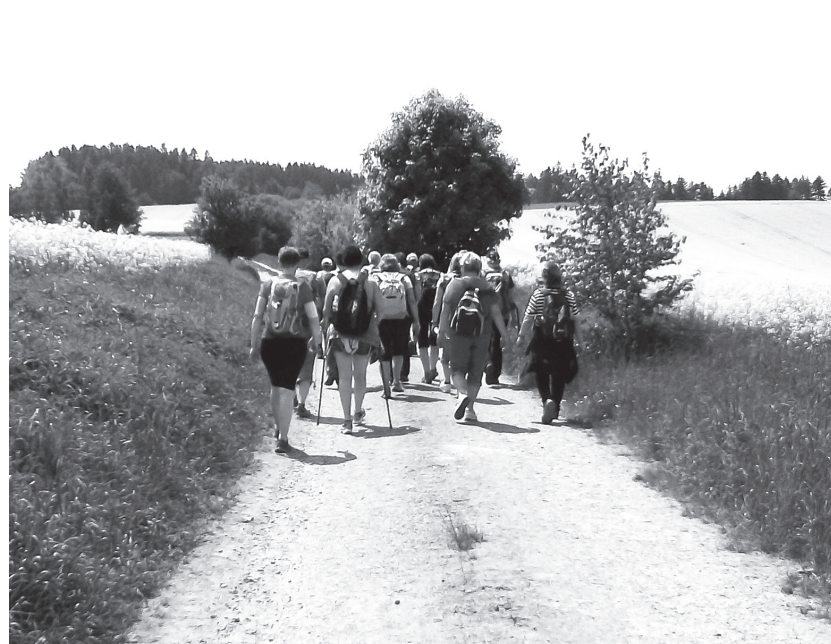
Boskovičtí turisté po nucené přestávce opět poznávají krásy naší vlasti. Minulou sobotu 21 turistů ušlo téměř 25 kilometrů v oblasti Svitavské pahorkatiny. Nechybělo ani malé okoupaní v přírodní nádrži.