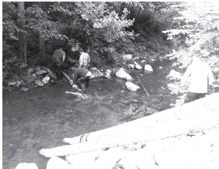
Spoiek rybářů z Boskovic v týdnu prováděl tzv. prahování toku části říčky Bělá. Je to z důvodu zadrženi vody v krajině a zlepšení životního prostředí ryb a dalších vodních živočichů.

dotány,“ sdělil radní pro dopravu Jihomoravského kraje Jiří Crha. Jihomoravský kraj v nově uzavřených smlouvách požadoval vyšší komfort pro cestující i řidiče a současně nastavil vyšší hodnocení pro dopravce, kteří nabídli ekologičtější vozidla. Cestující v nových autobusech čeká zejména lepší tepelná pohoda díky účinnějším klimatizacím a zdvojnásobným oknům. Přibude prostor pro cestující s kočárkem a vozíčkáře. Zvýší se ochrana řidičů i bezpečnost provozu díky uzavřeným kabinám a povinným couvacím kamerám. (hrr, zpr)