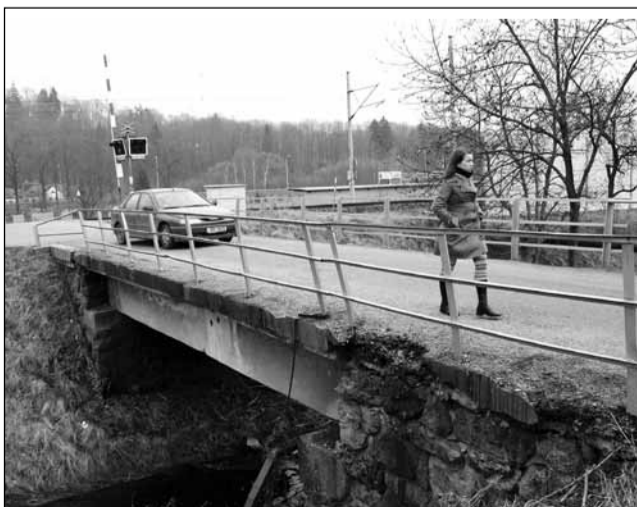
Oprava na spadnutí. Po dobu rekonstrukce se přes Křetínku v místě prací dostanou jen chodci.

Práce na opravě zkomplikují nejvíce život řidičům, kteří jezdí z Letovic do Zábłudova, Nýrova nebo Rudky. Řidiči budou muset jezdit přes Kunštát. V Letovicích vznikne provizorní objízdná trasa,