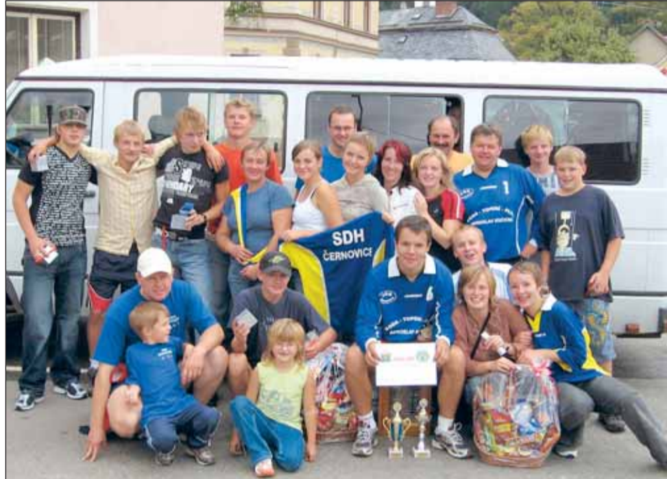
Stállice. Černovičtí hasiči okupují ve Velké ceně Blanenska tradičně nejvyšší příčky.

Černovičtí jezdí zejména Velkou cenu, kandidátské soutěže a okolní závody. Tradičně se zúčastňují nočních závodů v Telči a recesní soutěže „O po-