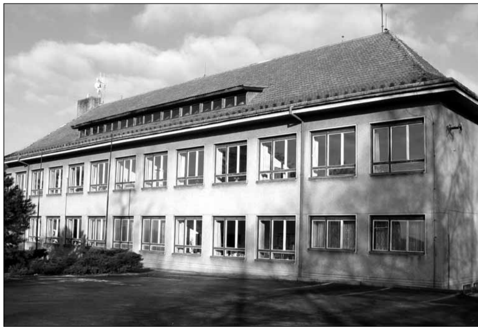
Čeká na zateplení. Benešovská škola dostane novou podobu.

Podle jeho slov se rozhodně nemusejí bát, že by jejich děti byly v nějaké ruině. Právě naopak. Brťovští do svého vzdělávacího zařízení investují a snaží se ho neustále vylepšovat. „Loni jsme opravovali střechu. Byla už