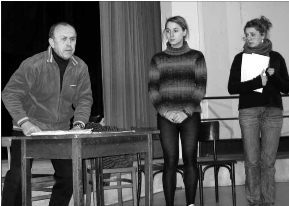
Zkouška. Před nadcházející premiérou se četnost a délka zkoušek zvyšuje.