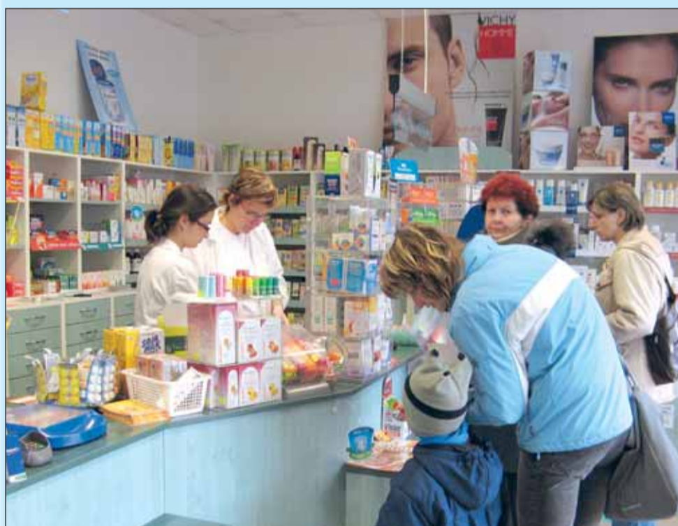
Ochotný personál lékárny u Kauflandu vám vždy odborně poradí.