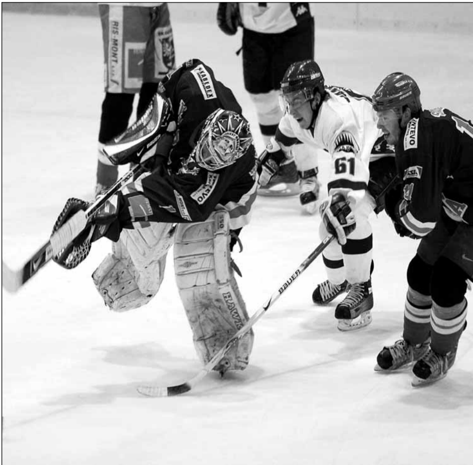
Jasná výhra. Letošní poslední domácí zápas před play-off Blansku vyšel. Karviná odjela na hlavu poražena.