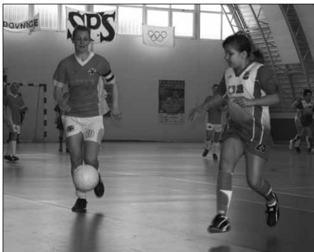
Boj. V utkání Kostelce s Kotvrdovicemi si pro vítězství dokráčely první jmenovaný tým.

Turnaj měl dvě kategorie. Mladší, v níž se představily hráčky bez zkušeností ze soutěžních bojů, byl hodně dramatický a otevřený až do poledního zápasu. Skupinu nakonec vyhrály mladé naděje FC Forman Boskovice před pořadající TJ Rakovec. Sympatické bylo vystoupení celků FK Adamov a Sokol Olomučany. Týmy, které s fotbalem teprve začínají, daly do hry svůj veškerý um a hlavně srdíčko. Ve vzájemném utkání o třetí místo měly nakonec navrch Olomuča-