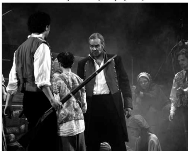
Představení. Valjean přichází na barikádu.

kém lidství a víře v Boha. Protože románová předloha Victora Huga je dostatečně známá a mnozí z vás viděli i pražská