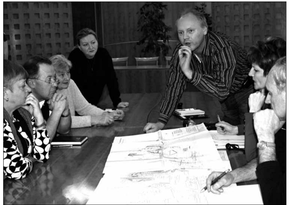
Jednání. Vedení Boskovic projednalo regeneraci sídliště i s jeho obyvateli.

Jednou z věcí, které by se podle přítomných lidí měly řešit, je systém vyústění chodníků na parkoviště. Jak uvedl jeden z obyvatel sídliště, výjezdy jsou