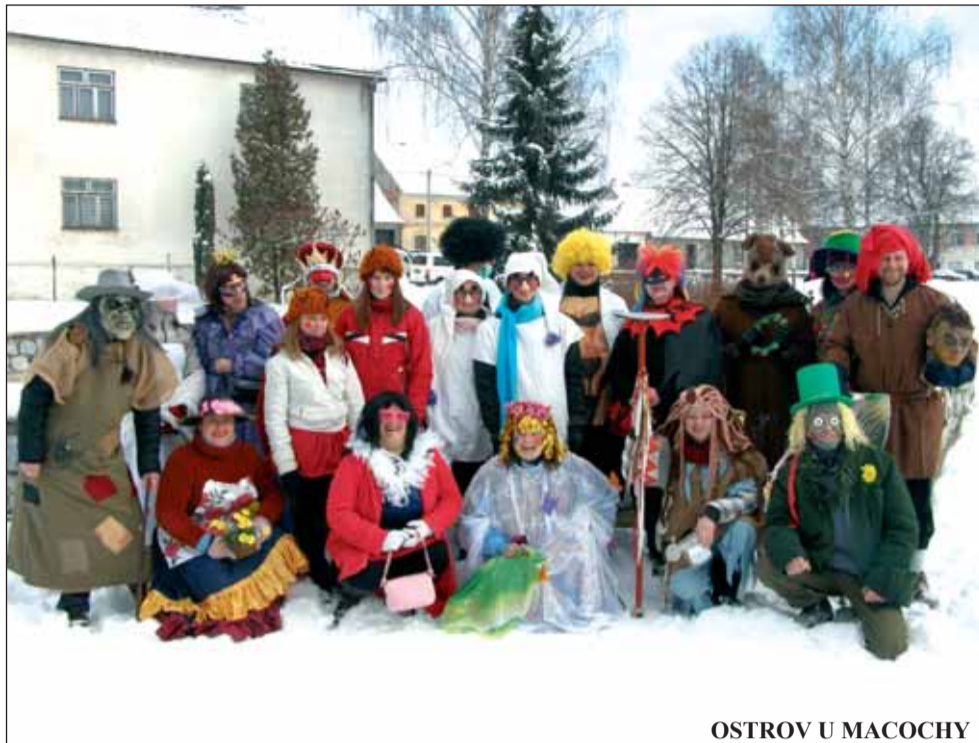
OSTROV U MACOCHY