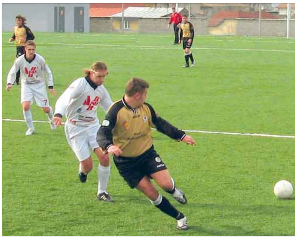
Vítězství. Blansko bylo po celé utkání lepším celkem. Domácí se k protiútokům dostávali jen sporadicky.

Druhá půle začala ve znamení tlaku Blanských. Záhy přišly jejich dvě obrovské šan-