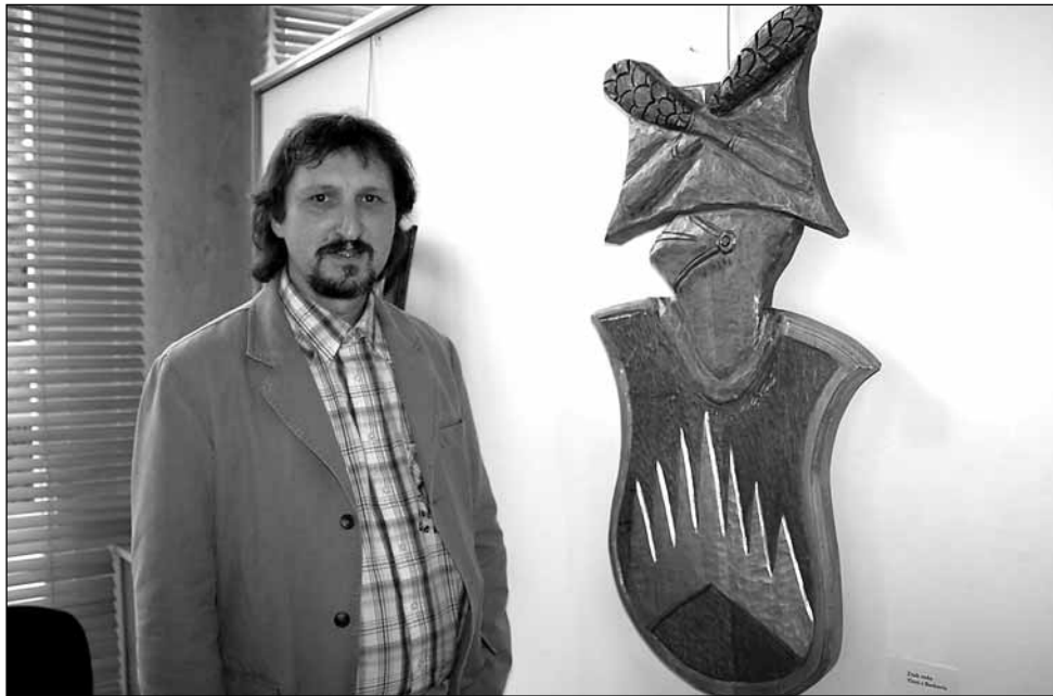
Epopej. Krajíček vystavuje část epopeje, ale také průřez svojí dosavadní tvorbou.

„Na člověka leze padesátka a říká si, že dokázal všechno, co by měl udělat správný chlap. To znamená počít syna, postavit dům a zasadit strom. Říkal jsem si, že by po mě mělo zůstat ještě něco na-