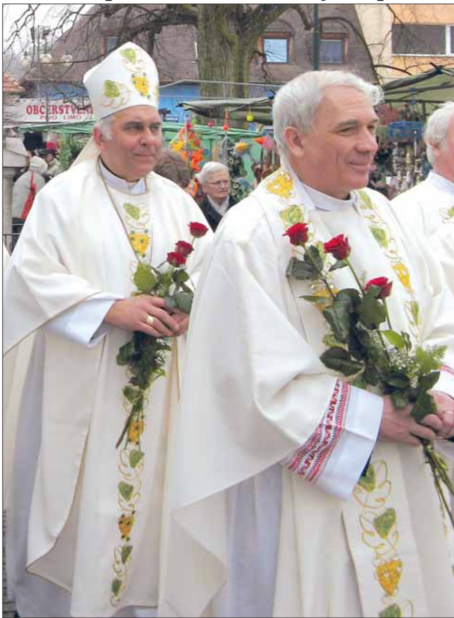
Květný pátek. Týden před Velkým pátkem je vždy termín pro sloupskou velkou jarní pouť. K Panně Marii Sedmibolestné připutovaly tisíce věřících ze všech koutů Moravy. Počasí přálo jen ráno, před polednem vytrvalý nepříjemný déšť slavnost pokazil.