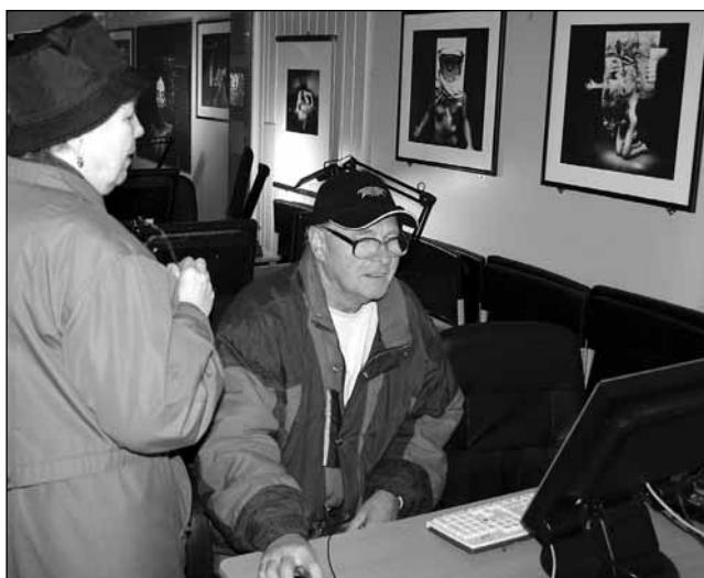
Internet na kolejích. Závěreční mohli brouzdat po síti nebo absolvovat školení.

Blansko – Lidé procházející minulou středu přes vlakové nádraží v Blansku se mohli podívat na internet nebo si vyzkoušet práci s počítačem a digitální technikou. A to přímo na kolejích. Celý den tam měl totiž zastávku tak zvaný Net vlak. Ve speciálně zařízeném vagonu byly k dispozici počítače připojené na internet, ale také lektoři Chráněných ICT pracovišť Deep, kteří každému ochotně poradili. Net vlak se po tuzemských kolejích bude pohybovat až do jedenadvacátého března a navštíví sedm železničních stanic. Jeho cesta skončí v Boskovicích. Akci pořádají České dráhy, Chráně-