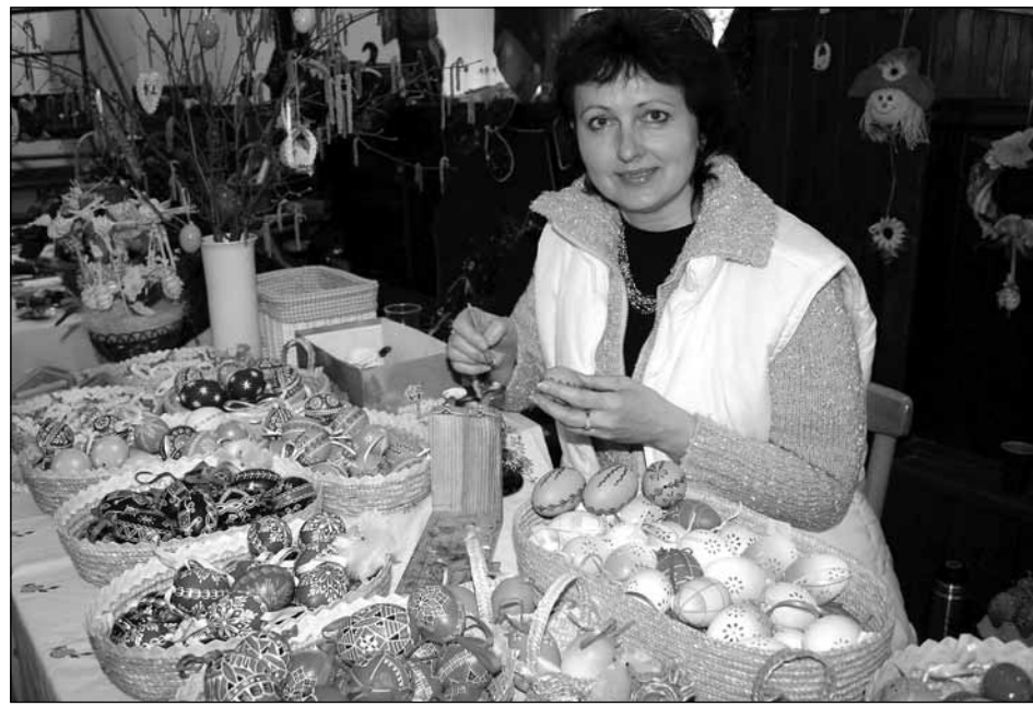
Výstava. Různá řemesla mohli v neděli na vlastní oči vidět návštěvníci velikonoční výstavy v kunštátském kulturním domě. Pořádalo ji Občanské sdružení řemesla Kunštát. K vidění bylo mimo jiné malování kraslic, pletení košíků, vyřezávání ze dřeva, tkaní nebo kovářská práce.