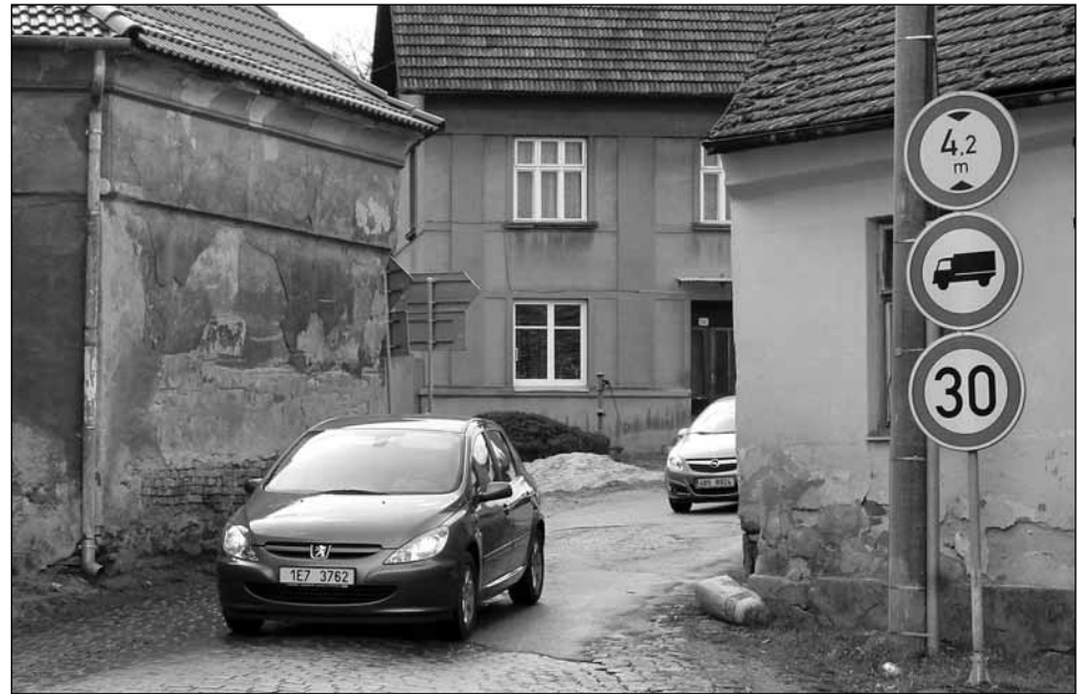
Dopravní problém. V rámci rekonstrukce náměstí by v budoucnosti měly zmizet problémy při výjezdu z jeho horního konce.

Společnost Zemspol Sloup získala v kategorii pekařských výrobků ocenění Zlatá chuť Jižní Moravy 2008 za svatební koláče ze své pekárny ve Sloupě, čestné uznání Chuť Jižní Moravy 2008 obdržely i další dva výrobky z pekárny ve Sloupu, vánočka a slunečnicový rohlík. Dalším oceněným výrobcem byl Pivovar Černá Hora, který získal ocenění za pivo