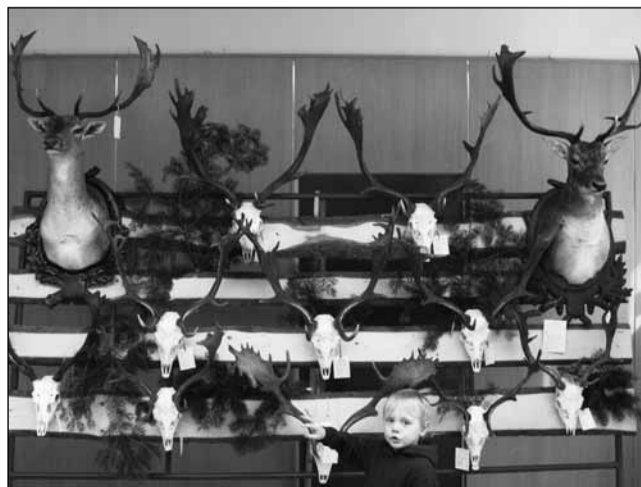
Výstava. Trofeje ulovené v roce 2008 představili myslivci v Černé Hoře.

Všechny trofeje ještě před výstavou obodovala hodnotitelská komise. „Mimo jiné určila, zda-li byl odlov proveden