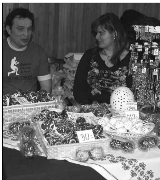
Za dveřmi. Velikonoce se blíží, a proto na tradičním jedovnickém jarmarku v sobotu nechyběly ani kraslice.