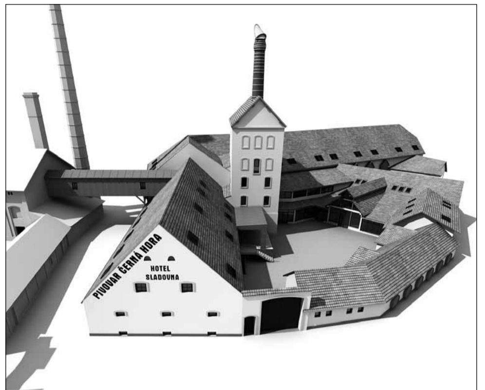
Hotel Sladovna. Výstavba plánovaného čtyřhvězdičkového hotelu začne v nejbližší době. Dodavatelem bude brněnská firma UNISTAV.