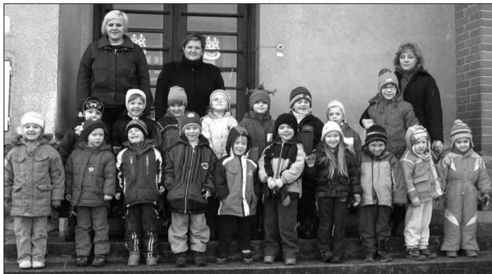
Nástup. Děti z býkovické mateřské školy se svými učitelkami.

Mateřskou školu v Býkovicích navštěvuje momentálně třináct dětí. „Naše kapacita je zcela naplněna. Více dětí vzít nemůžeme, protože tady máme zdravotně postiženou holčičku a současný počet nám stanovuje zákon. O děti pečují dvě učitelky a jedna asistentka pedagoga, která je hrazena na plný úvazek z rozpočtu krajského úřadu. Náš školní vzdělávací program je založen na programu zdra-