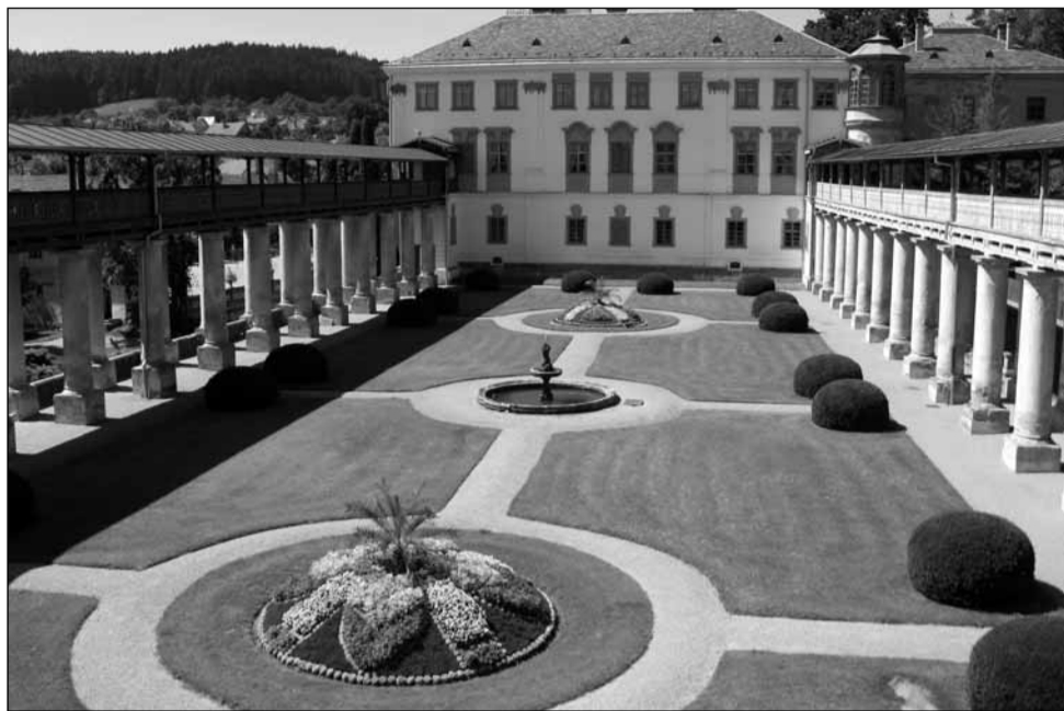
Historický objekt. Státní zámek v Lysicích se už těší na první letošní návštěvníky.

Podle ní jako každoročně mají pro milovníky historie kromě prohlídky zámku při-