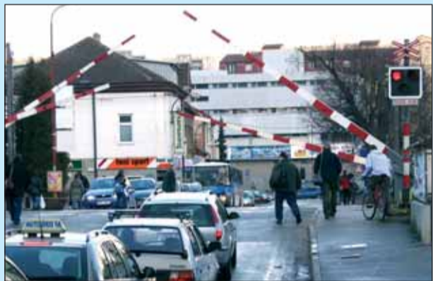
Hazard. Fotografie zachycuje riskování na přejezdu u zastávky v Blansku.

„Na železničním přejezdu je zakázáno předjíždět, otáčet se a couvat. Před takovým, který je opatřen značkou stůj dej přednost v jízdě, musí řidič zastavit vozidlo na takovém místě, odkud má náležitý rozhled na trať. Pro chodce platí, že nesmí vstoupit na přejezd, jestliže blikají výstražná světla, vstup je zakázán i v okamžiku, kdy jsou sklopeny nebo se zdvihají závozy. Chodec nesmí vstoupit na přejezd ani tehdy, kdy je již vidět nebo slyšet přijíždějící vlak,“ dodala Iva Šebková