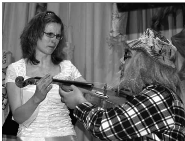
Trocha humoru. Muzikanti předvedli i scénku s pomyslnou „univerzitou třetího věku“ na jedovnické ZUŠ.

„V současné době poptávka po vzdělávání na naší škole převyšuje nabídku. Od příštího školního roku ale budeme moci přijmout o pětadesát žáků