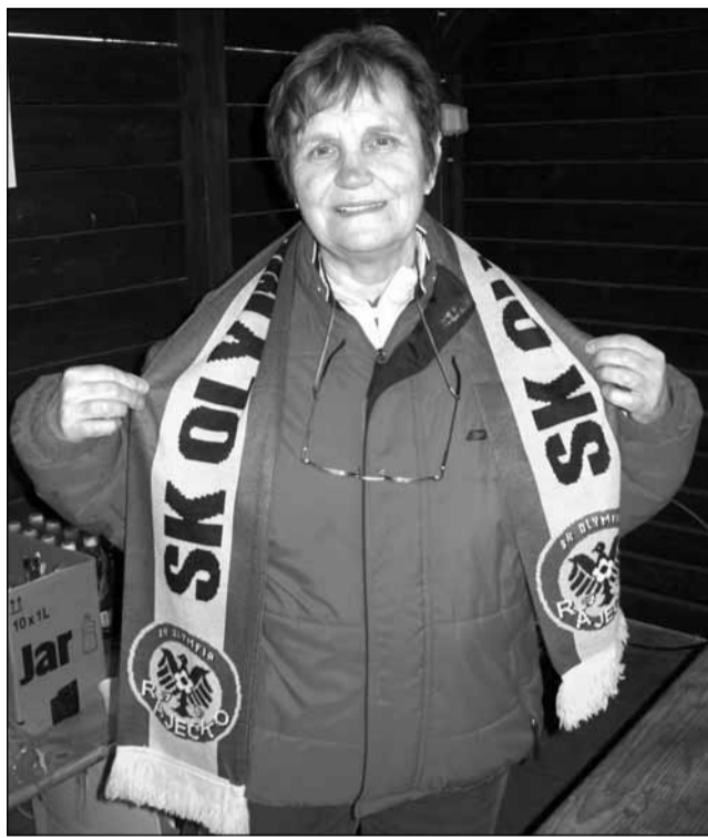
Klubové šály. Zelenožluté ozdoby na krku fanoušků měly v Ráječku premiéru.

Po změně stran se přece jenom trefil s chutí hrající Bartoš.