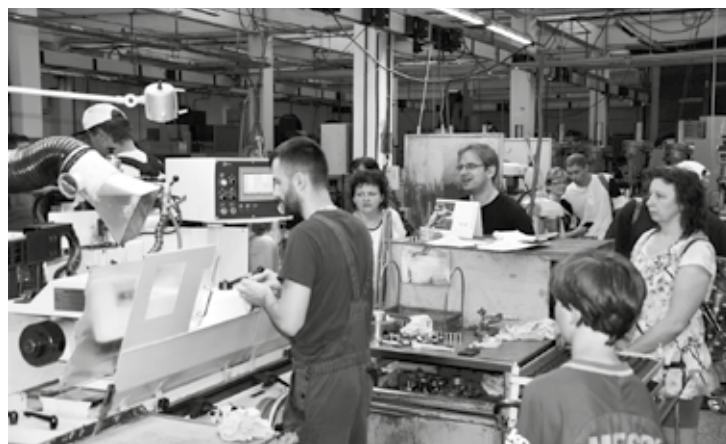
Ministerstvo pro místní rozvoj ve spolupráci s MINERVOU Boskovice, a.s., Muzeem regionu Boskovicka a Základní uměleckou školou Boskovice připravilo na sobotu 15. června v rámci projektu „Kde fondy EU pomáhají“ Den otevřených dveří v Minervě Boskovice.

Poslední dva řidiče pod vlivem alkoholu odhalily policejní hlídky během pondělí a úterý. Všem dvanácti řidičům byla zakázána další jízda a jejich protiprávním jednáním se budou policisté nadále zabývat. (hrr)