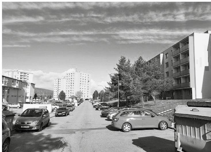
domům, oprava a přidání nových parkovacích stání: celkem tam bude 108

A co bude předmětem letošní regenerace v Kamnářské ulici? Kompletně nová místní komunikace, nové chodníky a přístupové cesty k bytovým