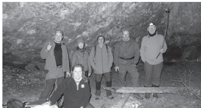
Turistické vycházky v Boskovicích opět zahájeny. První prosincovou sobotu využil Klub českých turistů Boskovice k obnově pravidelných vycházek. Dvou akcí se zúčastnilo celkem sedmadvacet turistů.