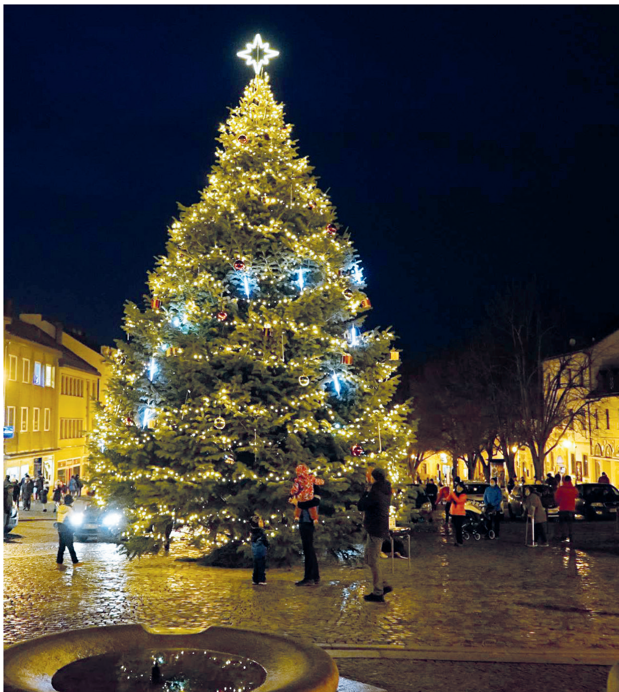
Vánoční strom svítí také na Masarykově náměstí v Boskovicích.