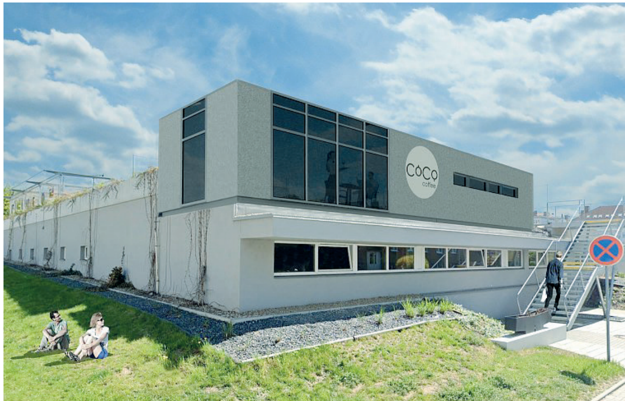
Vizualizace kavárny na Poduklí.