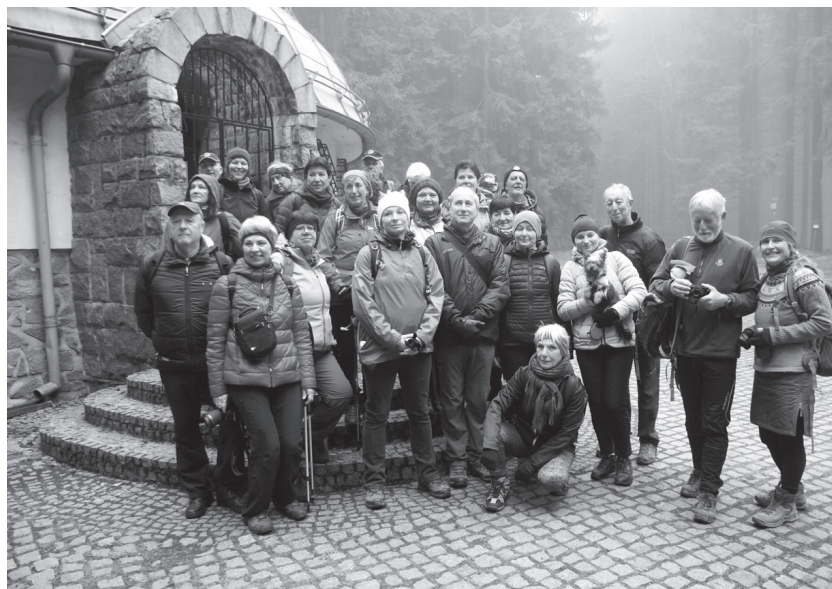
Boskovičtí turisté oslavili státní svátek 17. listopadu již tradičně vycházkou do vrcholových partií Dražanské vrchoviny. Potěšilo stále počasí a hojná účast devětatdvaceti turistů všech věkových kategorií.