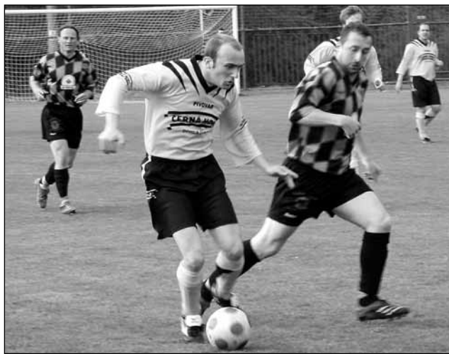
Derby. Olešnice nestačila na Černou Horu a odvezla si z jejího hřiště debakl.

Domácí byli v první půli pány na hřišti a převahu po zásluze přetavili ve vedoucí branku. Dvořáček střelil a Klepáček, jak jinak, doklepl. Po změně stran Olešnice zavelela k útoku. Proti byl domácí gólman Trávníček, který její snahu sérií skvělých zákroků úspěšně eliminoval. Následně se zápas zákonitě definitivně zlomil ve prospěch domácích. V 65. minutě dal na 2:0 Čepa, po chvíli Hlavička, jak jinak při hře se jmény než hlavičkou,