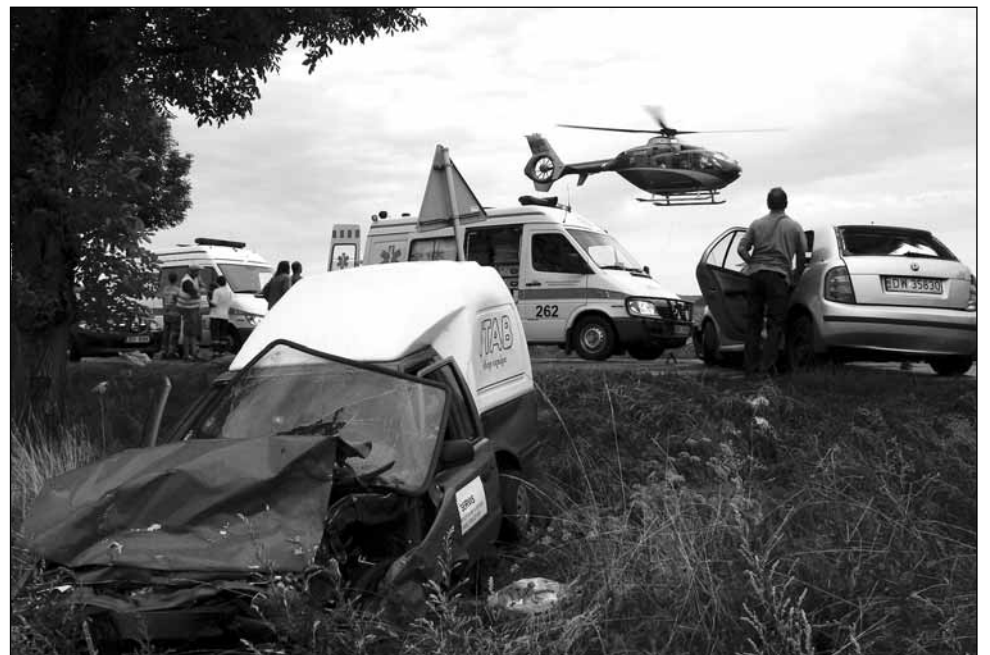
Problémy v dopravě. Velký provoz přináší často nehody.

„Jihomoravský kraj již mnohokrát deklaroval, že urychlené vybudování rychlostní silnice podporuje, protože je pro obyvatele obcí v jeho severní části životně důležité. Na tomto postoji se nic nemění,“ tvrdí rezolutně hejtman. Proto se připravuje dokument Zásady územního rozvoje, kde bude R 43 obsažena. „Důležitá jsou pro nás dvě hlediska. Za prvé bezpečnost obyvatel, za