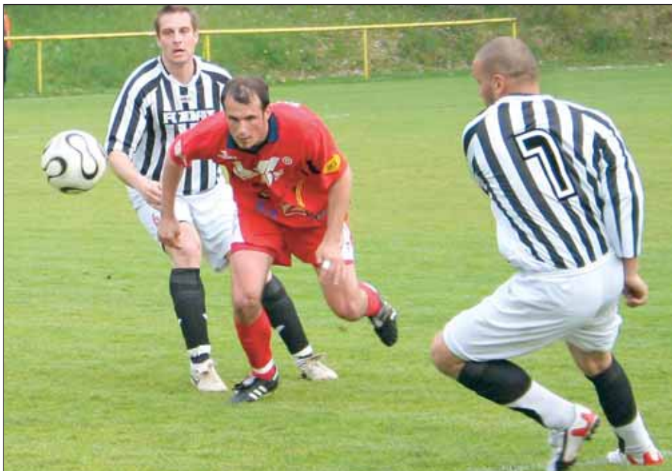
Remíza. V souboji prvního se třetím se v Blansku body dělily.

Ti, kteří se zapoměli u stánků s pivem a klobásou, přišli o první gól druhé půle. Postarali se o něj hosté, když využili zaváhání