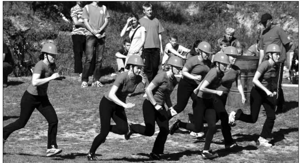
Na startu. Ženské družstvo z Běleč-Křeptova se ve Velké ceně Blanenska pohybuje už řadu let.

S hasiči z Běleč-Křeptova se určitě musí ve velké ceně počítat. Hned první rok, co ji začali jezdit, totiž ženy skončily na druhém místě a kluci na třetím. V roce 2005 zaznamenaly velký úspěch na celorepublikové recesní soutěži v Širokém Dole,