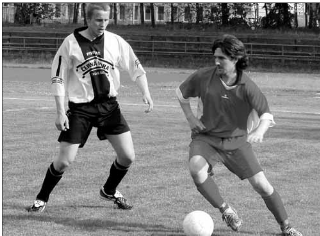
Střelnice. Ačkoliv dala Rudice v Blansku tři branky, nestačilo to ani na bod.

Domácí cítili povinnost vyhrát tento zápas, trápili se však. Podařilo se jim brankově uspět až v samém závěru. Ačkoliv předtím tři zcela vyložené šance zahodili, štěstěna jim nakonec přála. V 88. minutě byla za jasnou ruku nařizena penalta. Tu domácí Martínek proměnil a zajistil svému týmu tři body.