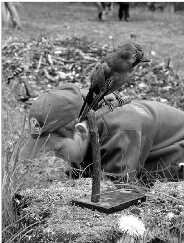
Poznáš to? Soutěžící museli prokázat velmi dobré znalosti.

Novinkou letošního ročníku bylo rozdělení účastníků do tří věkových kategorií. „Rozhodli jsme se, že dáme šanci i těm nejmenším. Soutěž je až od třetí třídy, ale my jsme letos vypsali kategorie