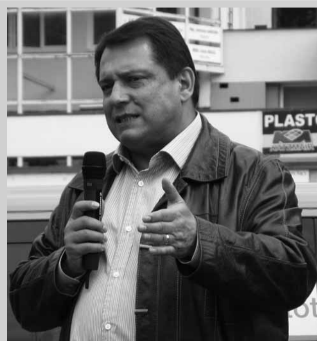
Mítink. Podpořit kandidáty České strany sociálně demokratické do Evropského parlamentu přijel do Blanska a do Boskovic osobně předseda strany Jiří Paroubek.

Letovičtí budou muset do budoucna řešit také otázku dokončení rekonstrukce městského úřadu a využití jeho dvorního traktu. Samozřejmostí by se měla stát jeho bezbariérovost, které napomůže nově budovaný výťah. Podle lidí je ale třeba modernizovat i obřadní síň úřadu, která už má zastaralé vybavení. Letovičtí se také zajímali o problémy rizikové mládeže, protipovodňová opatření nebo rozvoj turistiky.