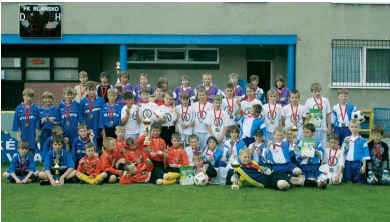
Turnaj. Okresním finále pokračovala republiková soutěž McDonald's Cup. Do krajského kola postoupili chlápci z Kunštátu, v mladší kategorii pak Knínice u Boskovic.