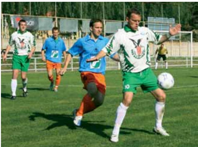
Prohra. Ve středečním utkání Rájec podlehli Rousínovu.