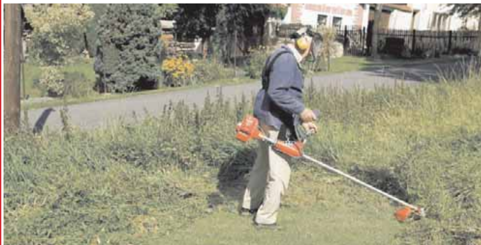
Velmi dobré hodnocení získala od nezávislého internetového magazínu iTEST například motorová kosa Mountfield Oleo-Mac Sparta 25.

Dalšími přednostmi stroje je jednoduchost konstrukce a velmi levná, snadná a jednoduchá údržba. Nemusí se například složitě seřizovat ani často promazávat, jak je to nutné třeba u lištových sekaček. Bubnovka má oproti motorové kose jedinou nevýhodu. Je trochu dražší. Ale o něco vyšší investici bohatě vynahradí rychlost sečení a pohodlí při práci.