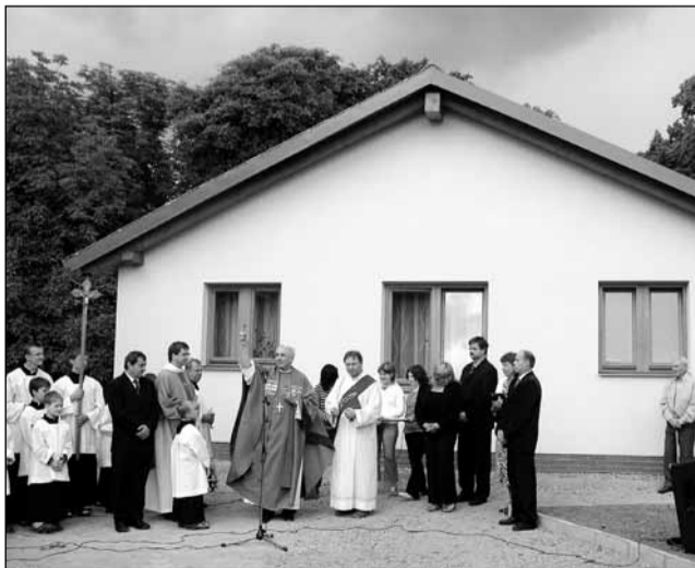
Slavnost. Na výstavbu pomohly peníze z prodeje staré fary, dotace z kraje i dary farníků.

Podle jeho slov ve staré budově chybělo sociální zařízení, problémy byly také se statikou objektu. „Navíc nebylo v našich možnostech sehnat prostředky na jeho obnovu. Rozhodli jsme se proto, že dům prodáme a postavíme nový, který bude navíc uzpůsobený pro potřeby farnosti. Ten starý byl totiž nejen zbytečně velký, nepraktický a měli bychom i po rekonstrukci velký problém ho provozovat,“ vysvětlil P. Kafka.