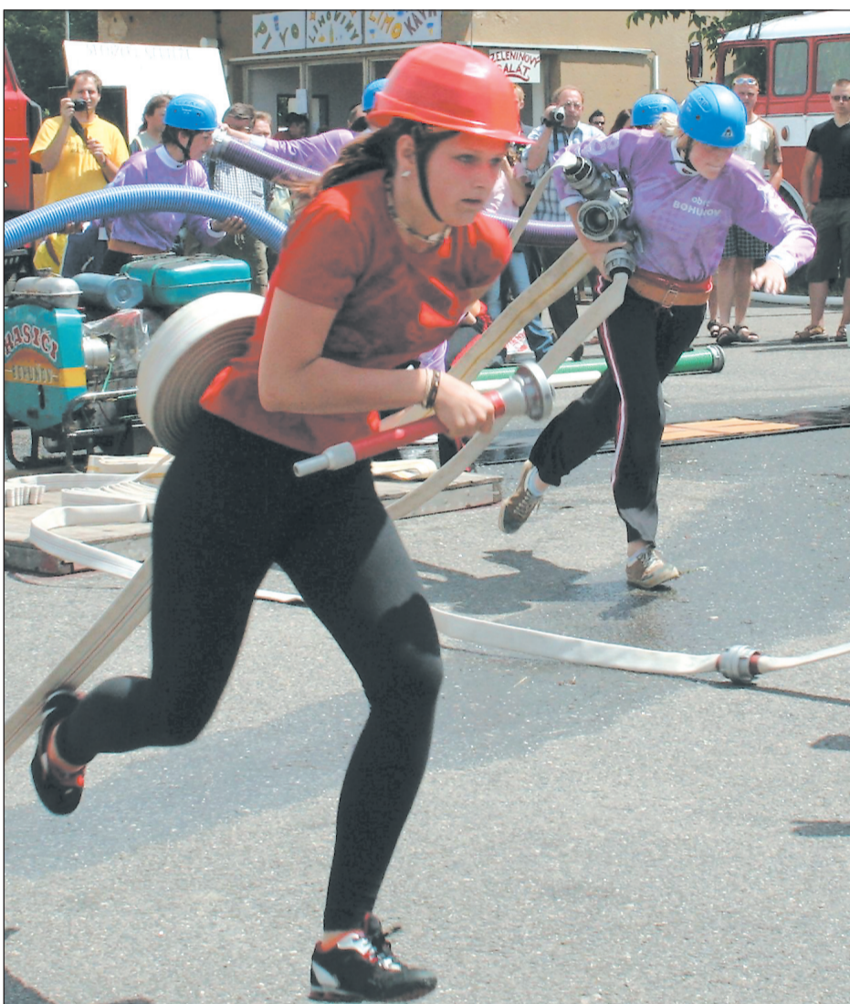
Velká cena. Dalším podnikem seriálu Velké ceny Blanenska v požárním útoku byly závody v Senetářově. Jako první přišly na řadu týmy žen (více na str. 3).