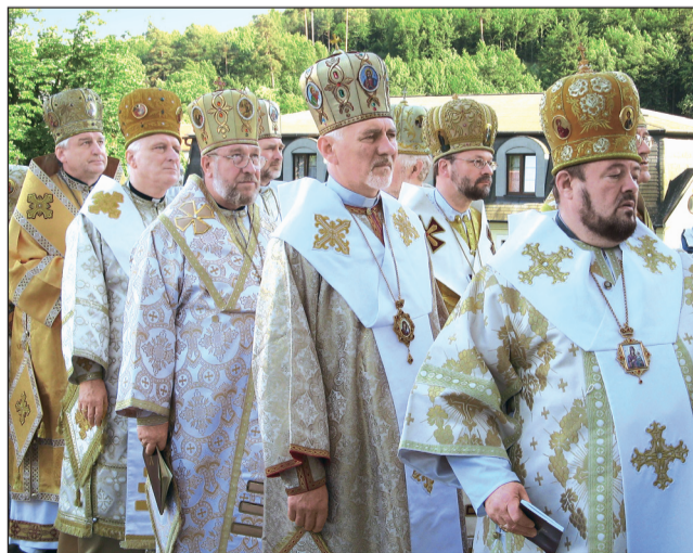
Slavnost. Biskupové před křtinským chrámem.