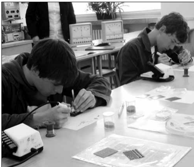
Modernizace. Díky projektu se studenti a učni mohou připravovat v pěti nových učebnách.

Po výborných zkušenostech se vedení školy rozhodlo pokračovat v nastoupené cestě. „Naši představu, že chceme být školou moderních technologií, stále výrazněji naplňujeme. Proto jsme v uplynulém týdnu podali další tři projekty v celkové výši kolem sedmnácti miliónů. Věříme, že budou úspěšné.“ plánuje ředitel. Čeho se týká?