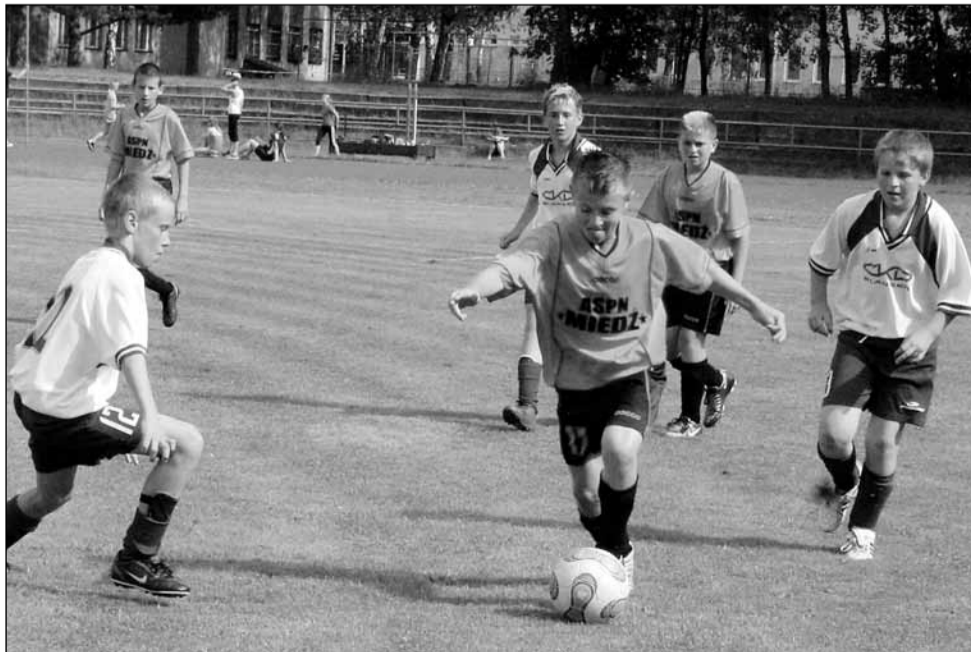
Turnaj. Hned v úvodním utkání turnaje na sebe narazili domácí žáci s kamarády z polské Legnice. Poláci vyhráli 0:4 a udělali tak první krok k celkovému vítězství.