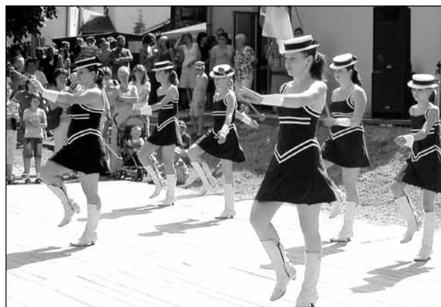
Slavnost. Odpoledne zprjemnily návštěvníkům oslavy svým vystoupením také mažoretky.

připravovali rozpočet na letošek. Je totiž nezbytné pro plánované opravy vyčlenit dostatek prostředků. Takže se nepřipravova-