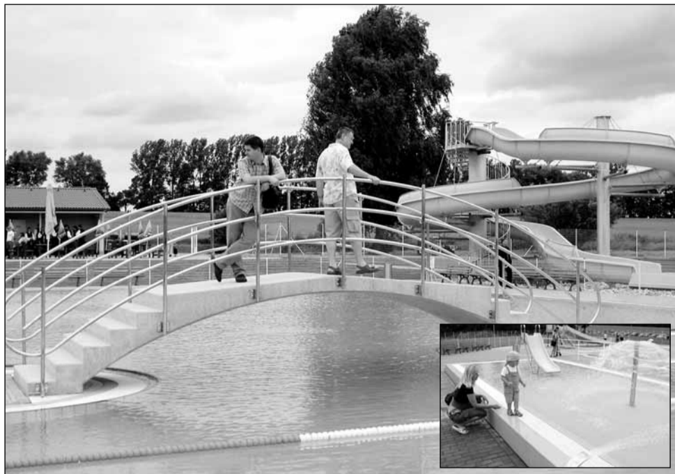
Vodní radovánky. Součástí koupaliště je řada vodních atrakcí.

O tom, že koupaliště umožní pobyt u vody lidem ze širokého okolí, svědčí následující čísla. Jen vodní hladina zabírá asi šest set metrů čtverečních. Kolem ní se nachází upravený trávník o rozloze kolem devíti tisíc metrů čtverečních. Kapacita bazénu je