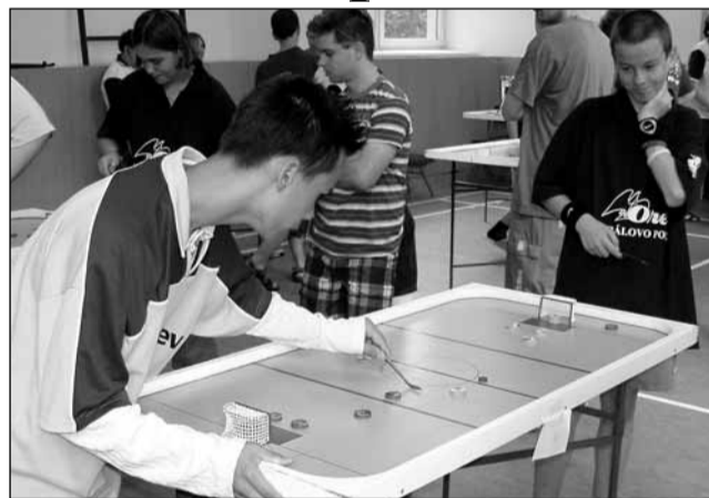
Šprtce. Mladí hráči z Boskovic potvrdili v republikové konkurenci své kvality.