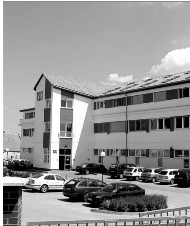
Firma. Sídlo společnosti VF v Černé Hoře.

Školicí centrum je určeno jak pro odborné vzdělávání a pro periodická školení zaměstnanců společnosti VF, tak i pro vzdělávání zaměstnanců či studentů jiných organizací. Vlastní zaměstnanci budou školeni například v oblastech radiální ochrany a ionizujícího záření, metrologie a radiálních monitorovacích systémů. Pro externí zájemce bude VF pořádát školicí akce, semináře, kurzy a konference v oblasti radiální ochrany a ionizujícího záření. Akce budou postupně určeny jak pro zájemce z průmyslu a jaderné energetiky, tak i pro lidi z oblastí zdravotnictví, školství, vědy a výzkumu, životního prostředí, veřejné i státní správy, včetně oblastí radiální i neradiální ochrany