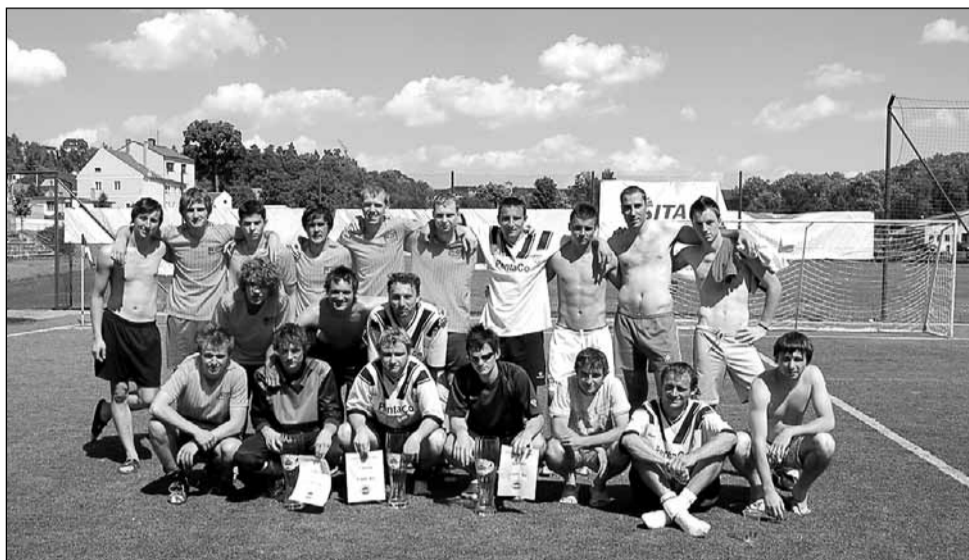
Finalisté. Po zásluze si to o titul na Forman Cupu rozdaly Pentaco Boskovice a Kunštát. Hosté byli úspěšnější.