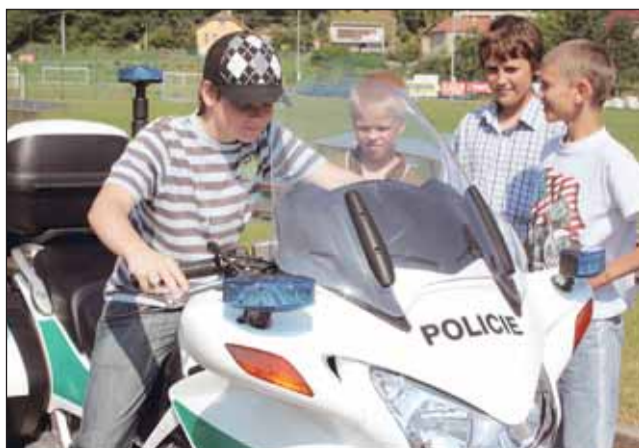
S policií. Návštěvníci akce mohli nahlédnout do zákulisí policejní práce.

„Po celý den byly připraveny různé ukázky práce. Přijela například jízdní policie s koňmi, předváděl se výcvik služebních psů nebo činnost zásahové jednotky. Přiletěl také vrtulník letecké záchraně služby. Pro