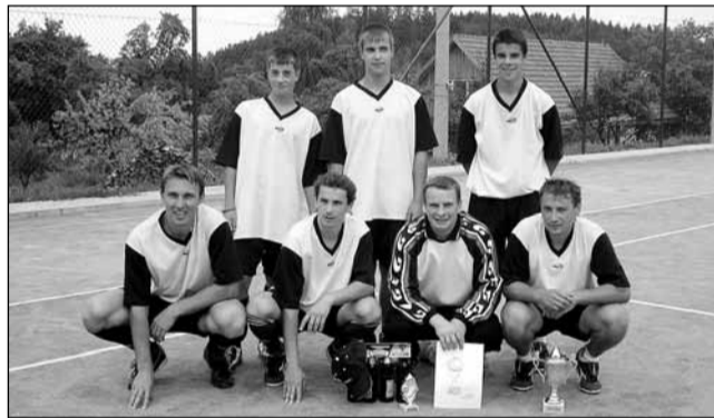
Turnaj. Oddíl malé kopané ve Lhotě u Lysic uspořádal první ročník Lhota Cupu. Vítězem se stal tým domácích LPP Lhota u Lysic, druhý skončil FK Eliška Brno a třetí FC Sebranice.

Závěrečná etapa trvala přesně šest hodin a deset minut a měřila 24,8 kilometru. Během ní se plavkyně potýkala zejména se zhoršenou kvalitou vltavské vody: „Tak zelenou vodu jsem ještě nezažila. Pod hladinou byla absolutní tma, všude po těle se mi usazovaly sinice, takže jsem musela místy plavat znak, abych vůbec mohla dýchat,“ řekla Hlaváčová. „Nakonec jsem ráda, že nebylo až tak tak pěkné počasí, protože pak by se v tom asi už nedalo plavat vůbec,“ dodala. Fotografie z Vltavatour uveřejníme v příštím čísle.