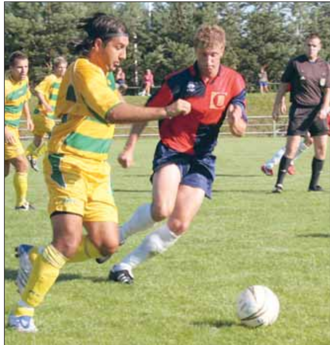
Konec. Fotbalistům Rájce-Jestřebí vystavily v prvním kole poháru stop Mutěnice.

V nich nejprve otevřel skóre Macík. Kroměřížský hráč mřil nad, aby Ošlejšek přidal druhý gól. Hosté snížili na 2:1. Pak ale přestřelil Müller a přišly velké chvíle Šmída. Třetí sérii uzavřel skvělým chycením kroměřížské střely a když nezaváhal Vladan Horák, čtvrtou penaltu hostů opět zlikvidoval a mohlo vypuknout veselí.