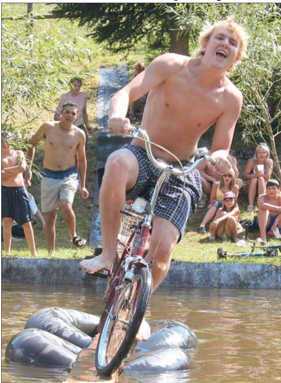
Do vody. Hned dvě podobné recesistické akce se konaly o uplynulém víkendu v našem regionu. Na programu byl sedmý ročník Lažanské fošny a druhý ročník Drnovické lávky (viz. foto). Více na str. 6