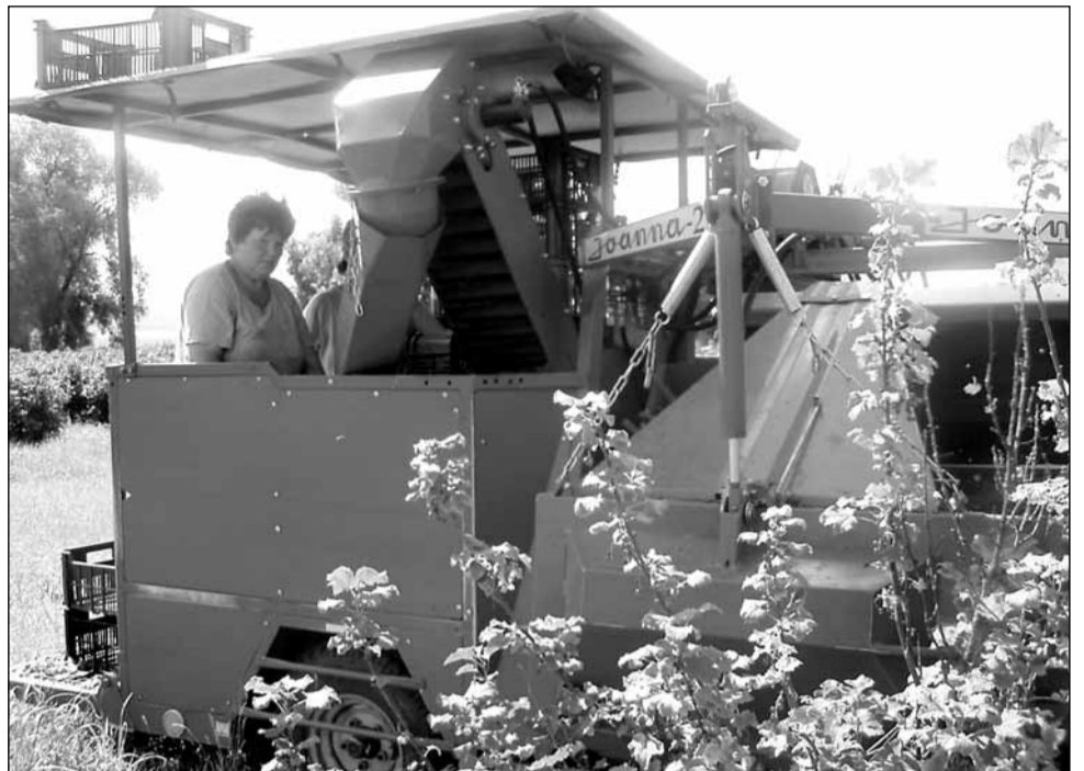
Pomocník. Při sběru rybízu využívají Lysičtí „kombajn“.

Co se týká odbytu, Lysičtí vozí červený rybíz do Přerova. „Tak je tomu i letos, ale znovu musím opakovat, vykupuje se