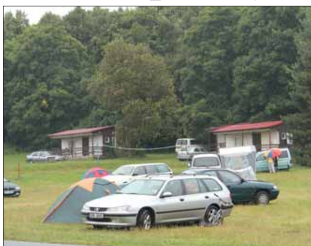
Špatná sezóna. Běžně bývá v tuto dobu v jedovnickém kempu plno.