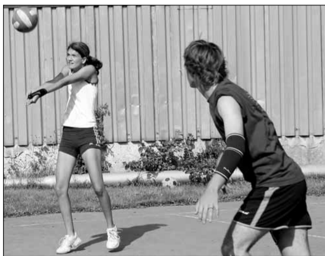
Turnaj. Velká bitva se odehrávala také na volejbalovém kurtu.

Sdružení podle jeho slov vzniklo 30. prosince 2005