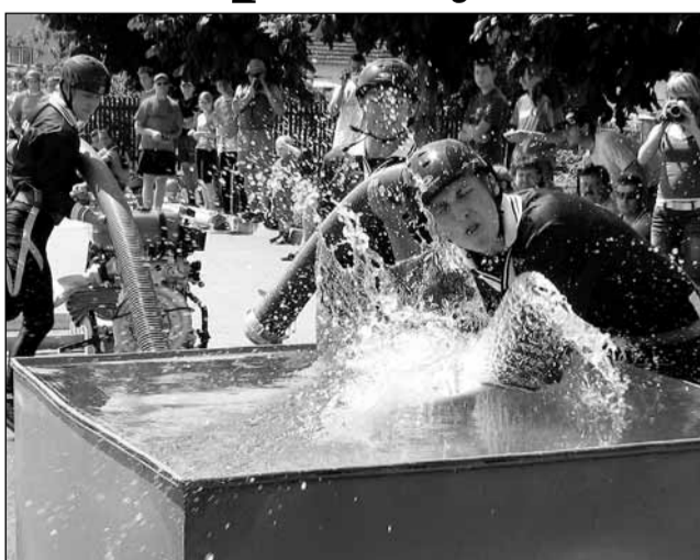
Na trati. Pořadatelé v Černovicích odvedli dobrou práci a připravili kvalitní trať.

Na místní dráhu přijelo změnit síly sedmatřicet týmů mužů a sedmnáct týmů žen, mezi nimi i kolektivy z jiných okresů, například SDH Petrovice z okresu Třebíč, držitel republikového rekordu, který má hodnotu 16,42 s, nebo SDH Litava z okresu Brno-venkov, momentálně čtvrtý tým Extraligy ČR. Mezi ženami to byl kupříkladu Lhotky Team, průběžně druhý tým Extraligy.