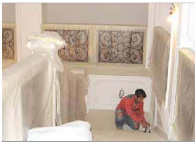
Přípravy. Dělníci v těchto dnech dokončují poslední drobnosti, poté začne stěhování exponátů.

Velké Opatovice – Další část zámku ve Velkých Opatovicích, ve kterém sídlí například městský úřad, kartografické centrum nebo kino, se postupně rekonstruuje. Vedení města v západním křídle připravuje prostory pro nové muzeum. Návštěvníci by se do něho měli poprvé podívat už 29. srpna.