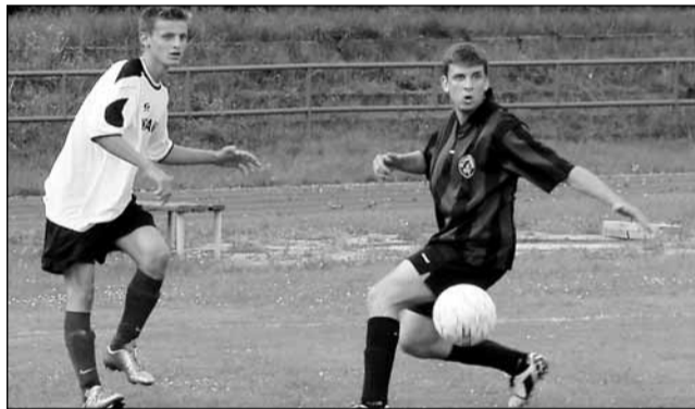
Prátnělský. Poprvé pod vedením nových trenérů se před sezónou prátnělský utkalo blanenské běčko se Sloupem. Blanenský junióri vyhráli jednoznačně 7:1.