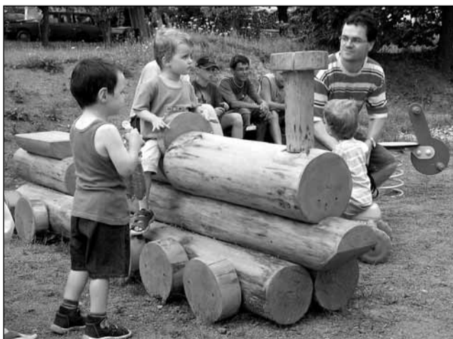
Místní části. Před rokem bylo v Klepačově otevřeno hřiště pro nejmenší.

„Nejvíce peněz budeme letos investovat v Klepačově. Vznikne zde víceúčelové sportovní hřiště s umělým povrchem v hodnotě kolem pěti milionů korun,“ uvedl místostarosta Jindřich Král. Zámyslem radnice je postupně podobné zařízení vybudovat ve všech místních částech. „Následovat by měly Dolní, potom Horní Lhota a Lažánky,“ plánuje Král. Realizace akce se ale zatím