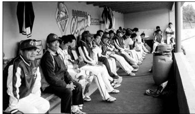
Šampionát. Místo plánovaných čtyř utkání akademického mistrovství světa v baseballu se v Blansku uskutečnilo nakonec jen jedno. Celek Tehaj-wanu v něm porazil Litvu jasně 7:1.