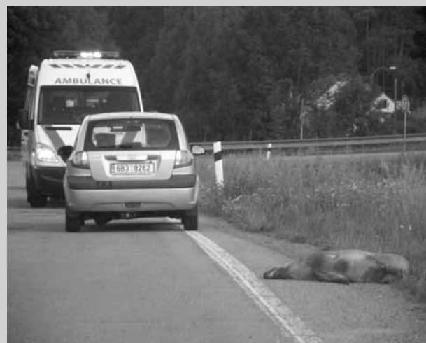
Nehoda. Divoké prase vběhlo do cesty jednatřicetiletému řidiči motorky na silnici mezi Jedovnicemi a Lažánkami. Výsledkem byl střet, po kterém byl motorkář lehce zraněn a divoké prase zabito. Řidič před jízdou ani během ní nepožil alkohol. Na motocyklu vznikla škoda asi pětadvacet tisíc korun, mysliveckému sdružení pak dalších pět tisíc korun. (hrr)