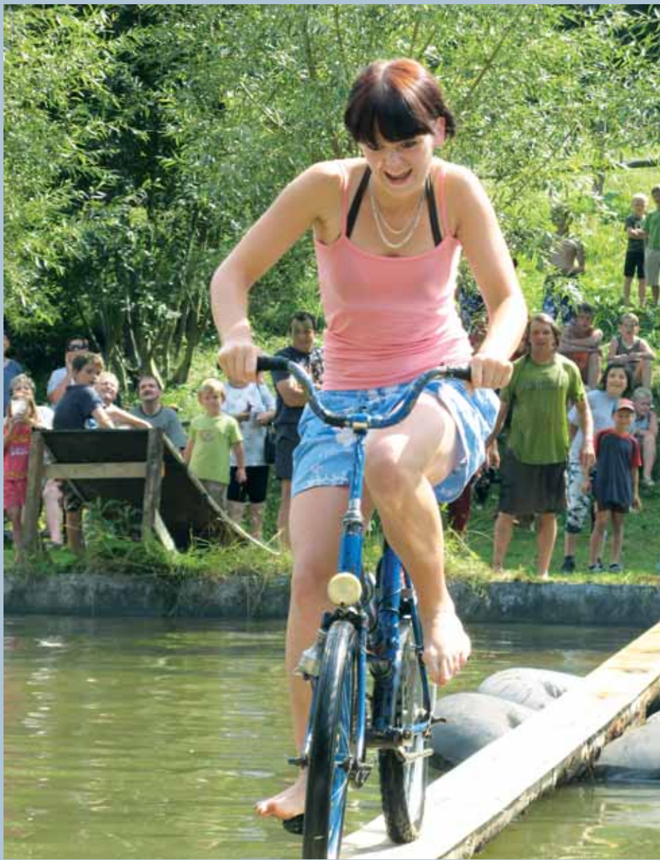
Recese. Povedené odpoledne uspořádali v sobotu na bývalém koupališti v Drnovicích. Součástí zábavné akce bylo přejetí lávky na kole, souboje nad vodou se „zbrani“ i v přetahování a na závěr i v bahně. Více fotografií na str. 12.