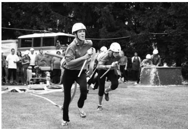
Ženy. I přes vrtochy počasí se pořadatelům v Němčicích podařilo připravit kvalitní trať.

Tradičně také domácí zahájili soutěž v kategorii mužů, a hned na úvod nasadili laťku na hodnotu 18,52 s. V koneč-