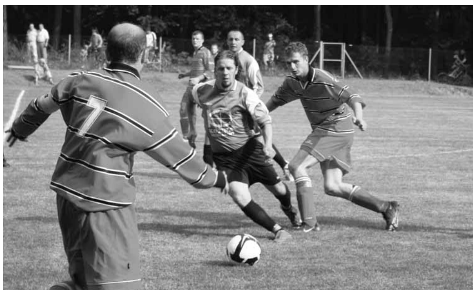
Tři body domácím. Sloupu premiéra vyšla, Doubravici porazil vysoko 4:0.

Domáci zahájili drtivým nápretem, dech jim ale došel, když ve 20. minutě inkasovali branku. Ve 33. minutě se jim podařilo vyrovnat, když Hlaváček usměrnil svoji hlavičku přesně do vinklu