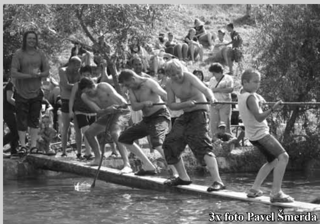
3x foto Pavel Šmerda