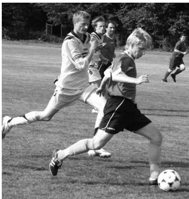
Derby. Zápas mezi Černou Horou a Kunštátem příliš fotbalově krásy nepřinesl. Ze zisku bodů se radovali hosté.

V prvním poločase toho obě mužstva divákům mnoho nepředvedla. Výjimkou byla pouze 10. min., která se později ukázala jako rozhodující. Na přímý kop si nejvýše vyskočil Novotný, míč z jeho hlavy se oťel o tyčku a zapadl za záda brankáře Poláka – 0:1. Na za-