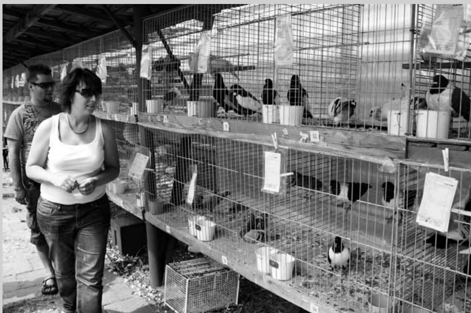
Holubi. Sobota a neděle patřily v Olešnici Okresní soutěžní výstavě králíků, holubů, drůbeže, exotů, akvarijních ryb a plazů, konané tradičně v terminu poutí. V chovatelském areálu se návštěvníkům představilo kolem pěti set zvířat.

vysvětlit, co vlastně vaše oddělení léčí?