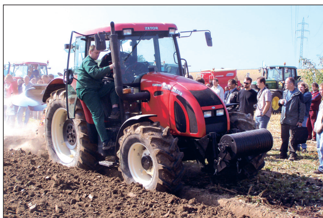
Akce. Tradiční akce se konala u Lysic.

ale samozřejmě vylepšené o určité technické drobnosti. Co se týká úplných novinek, tak ty si necháváme na blížící se veletrhy v Hannoveru a v Brně,“ doplnil ředitel