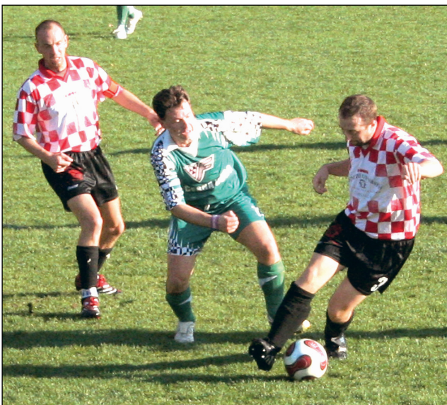
Derby. V utkání mezi Olešnicí a Černou Horou byli nakonec šťastnější domácí.