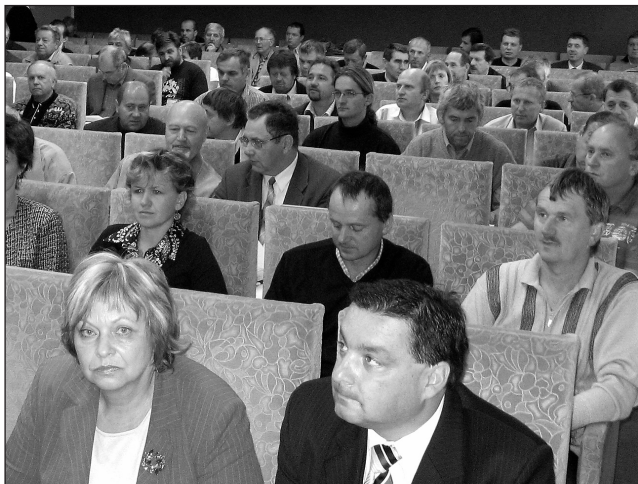
Setkání. Starostové z okresu se sešli na zasedání v Blansku.

„Jedná se o pravidelnou akci vždy jednou za půl roku. Chceme být s radnicemi v těsném kontaktu, taková setkání považujeme pro obě strany za přínosná,“ řekl před zahájením Crha. Jak dodal, na program byly novinky v legislativě, dotační tituly z evropských fondů, příprava rozpočtu na příští rok. „Žádnou oblast názorových střetů neočekávám,“ plánoval.