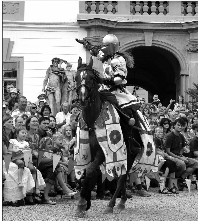
Zábava. Tradičně velký zájem je o doprovodné akce Lysických jeřitů.

Až zdi památky opustí poslední turisté, začnou nanovo práce na statickém zajištění objektu. Už v říjnu nastoupí pracovníci