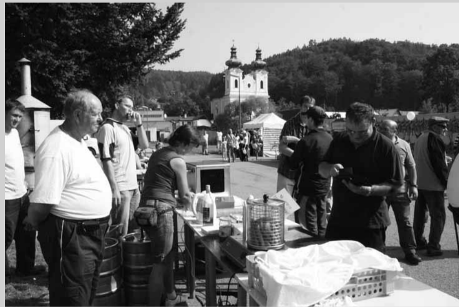
Nová tradice. U příležitosti podzimní Mariánské pouti se ve Sloupu rozhodli uspořádat první medový jarmark. Místní doufají, že se akce stane tradicí.