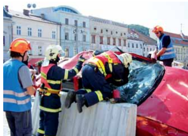
Úspěch. Boskovičtí profesionální hasiči uspěli na soutěži v mezinárodní konkurenci.

Profesionální hasiči z Boskovic se soutěže v Banské Bystrici zúčastnili již potřetí. V roce 2007 vyhráli, loni skončili na čtvrtém místě. „Ukázala se vyrovnanost našeho družstva při soutěžích ve vyprošťování. Za úspěchy stojí velká snaha a hodiny tréninku. Nejsložitější je zajistit dostatečný počet vraků aut pro nácviky, jejich dopravu