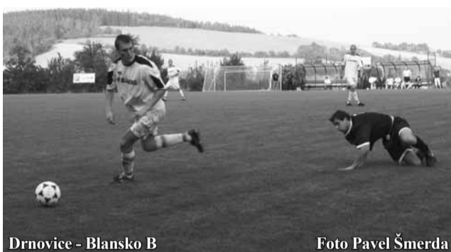
Drnovice - Blansko B

Oba týmy nastoupily oslabeny o klíčové hráče. Utkání bylo vcelku vyrovnané, šance však dokázaly proměnit jen Letovice. Poprvé se radovaly zásluhou Řezníka, který v pádu dokázal přehodit rudického brankáře. Pojistka přišla čtyři minuty před