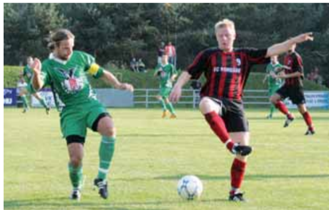
Další výhra. Ani v utkání osmého kola krajského přeboru Ráječtí nezaváhali a porazili soupeře 3:0.