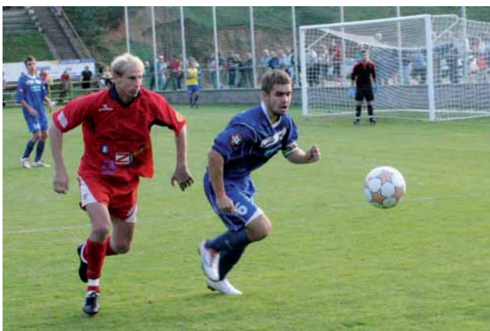
Výhra. S odřenými ušima získalo Blansko doma tři body s Vyškovem.