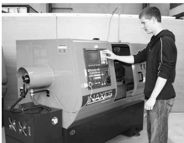
Novinka. Studenti jedovnické průmyslovky se už těší na moderní stroje.

„Výhody? Každý student, který se naučí pracovat na těchto nových strojích, bude mít mnohem snadnější přechod do pracovního procesu vyspělé firmy než doposud,“ uvedl Nečas. Nové centrum budou podle něj využívat všichni studenti školy, do budoucna Jedovničtí uvažují také o možnosti nabídnout prostory na rekvalifikace pracovníků z úřadu práce.