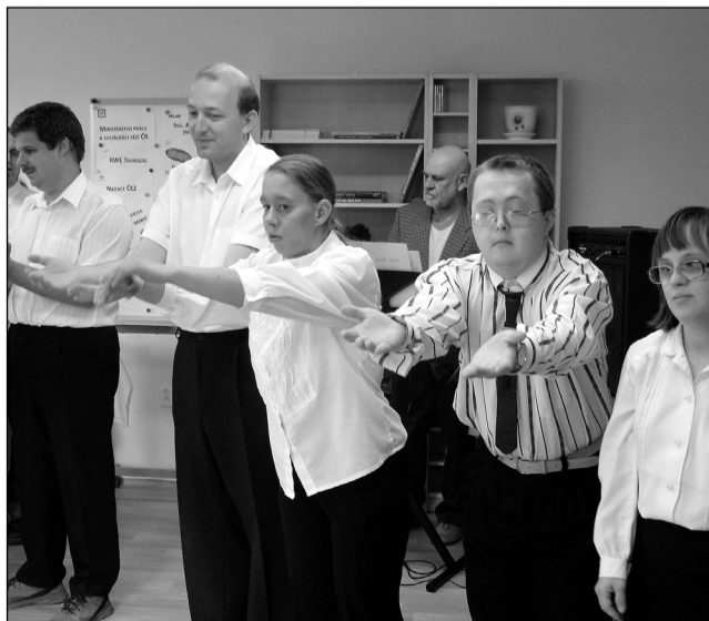
Nová přístavba. Při slavnostním otevření vystoupili klienti blanenské Domova Olga.