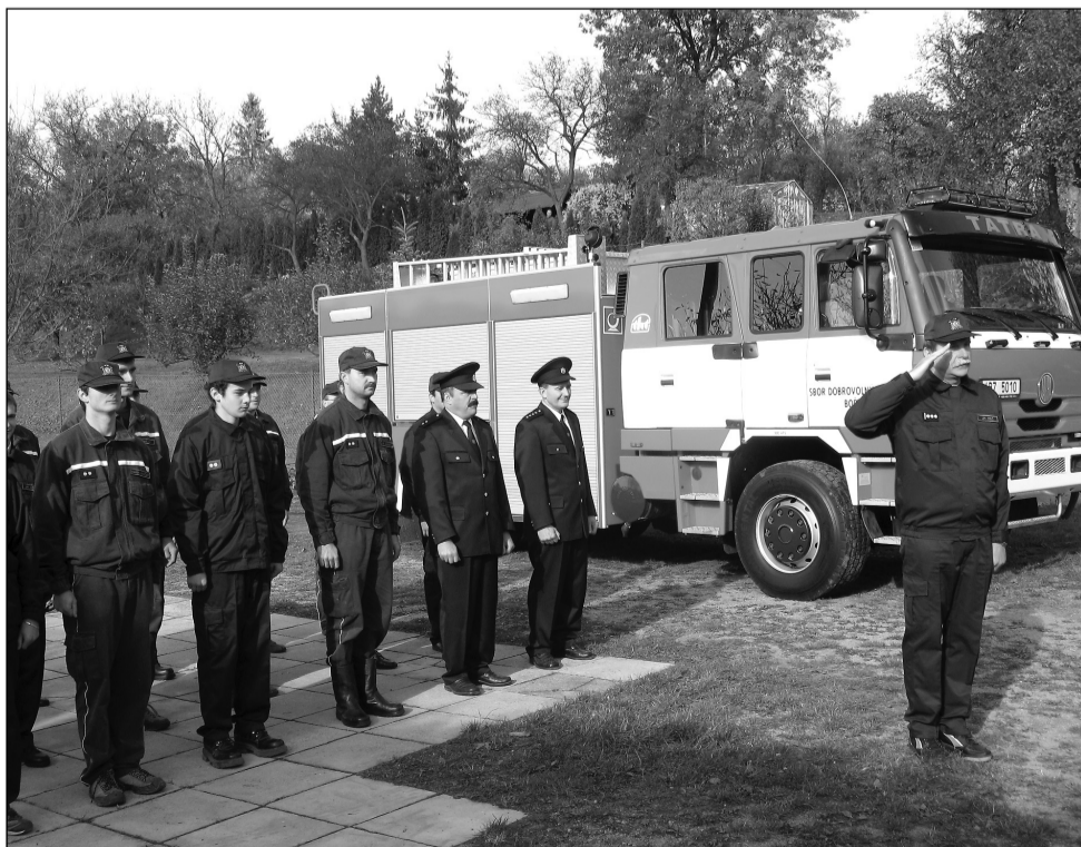
Technika. Bořitovští hasiči mají od soboty posvěcenu novou techniku.