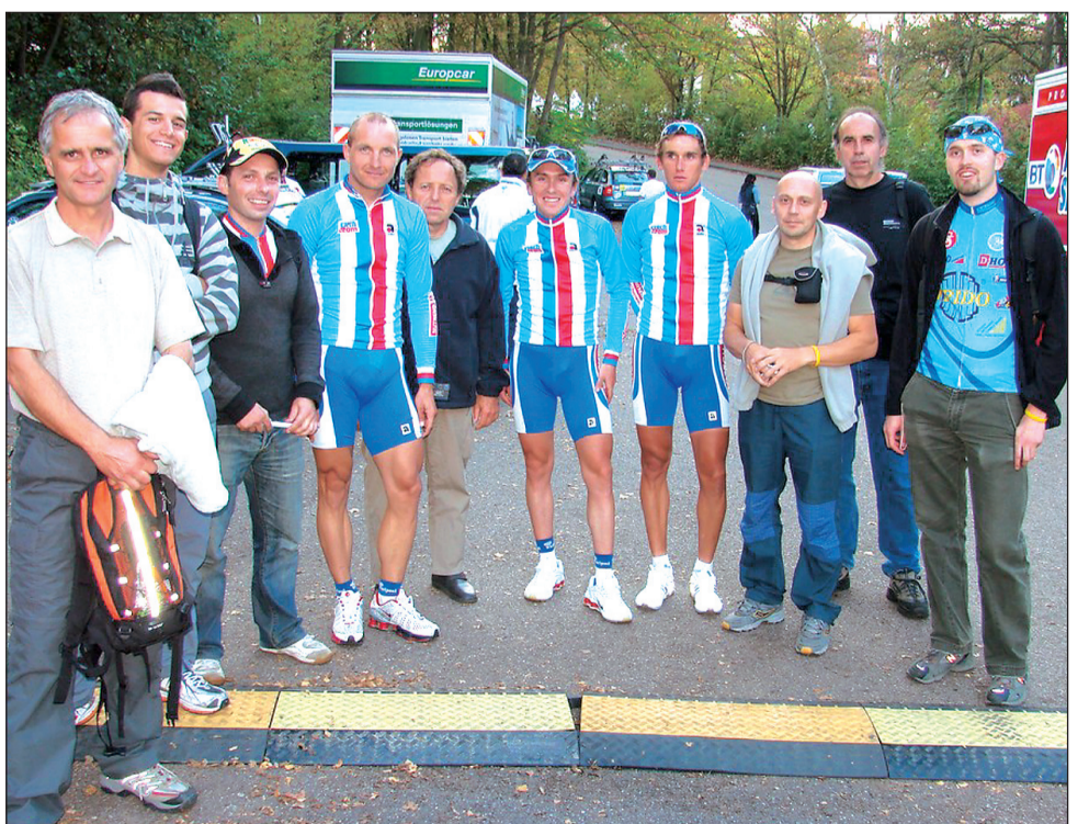
Šampionát. Ráječkovská výprava se ve Stuttgartu vyfotografovala i s trojicí českých reprezentantů.