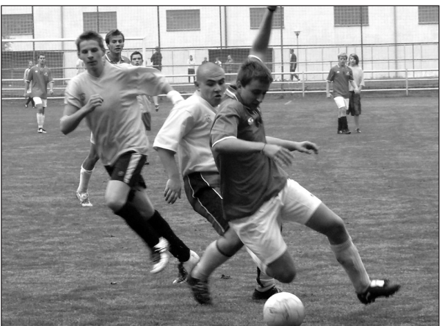
O okresního přeborníka. Na hřištích FK Blansko bojovalo o titul okresního přeborníka osm středoškolských výběrů. Výsledky viz str. 9.

KRD upozorňuje všechny rozhodčí, kteří dostávají obsazení rozhodčích OFS e-mailem, že směrodatné je obsazení, které vychází v pravidelném týdeníku ZRCADLO , nikoliv obsazení, které Vám zasláme e-mailem!!!! Oproti e-mailu, který Vám zasíláme může být v novinách aktuálnější změna provedená obsazovací komisí!!!!