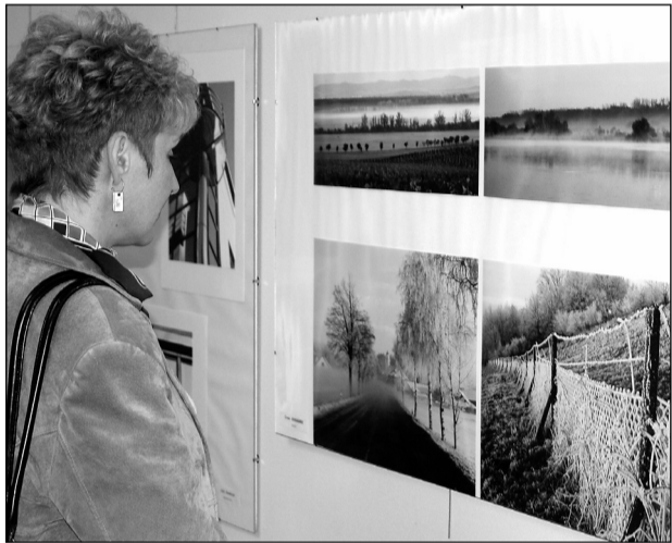
Zachycený okamžik. Výstava fotografií nabízí práce různých žánrů.

Klub moravských fotografů vznikl v roce 1987 z lidí, které učil také letovický fotograf Bohumil Kocina. Na počátku se sešlo asi patnáct zakládajících členů. Od té doby fotí, schází se, veselí se, tak jak je zapotřebí. „Člověk se také potřebuje odreagovat. Není možné jen sledovat černou kroniku a ty šílené titulky v novinách. Jak máme čas, tak vyrazíme do přírody nebo do ateliéru. Fotografie si vzájemně ukazujeme, hodnotíme a pomlouváme, tak jak už to v životě je, ale přitom si myslím, že jsme natolik kritičtí a sebe-kritičtí, že kritika je vždy k dobru věci,“ řekl Jiří Sláma. (hrr)