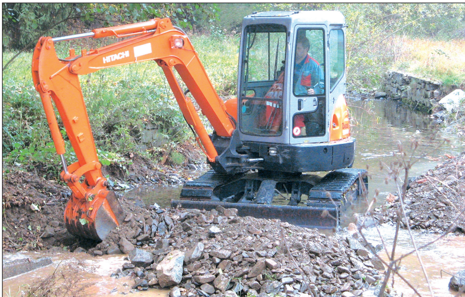
Ochrana před povodní. V těchto dnech provádí ve Sloupi Povodí Moravy úpravu potoka Luhy na okraji Sloupu. Břehový porost bude vykácen a korytem po vyčištění proteče více vody. Dojde také ke zpevnění břehů kamenným záhozem. (bh)