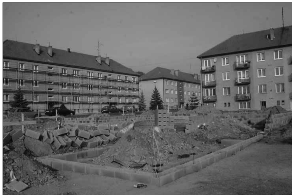
V plném proudu. Mezi sloupovými bytovkami začaly vyrůstat základy nově budovaného domu pro seniory. Podle slov starosty Josefa Mikuláška je třeba do konce roku prostavět a vyúčtovat dotaci v celkové výši 4,5 miliónu korun. Na základové desce bude stát montovaná stavba, bydlení zde najde v první etapě sedm seniorů.