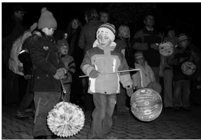
Oslava. Městys Lysice uspořádal u příležitosti oslav 90. výročí vzniku samostatného československého státu lampiónový průvod. V kulturním programu vystoupili žáci školy.