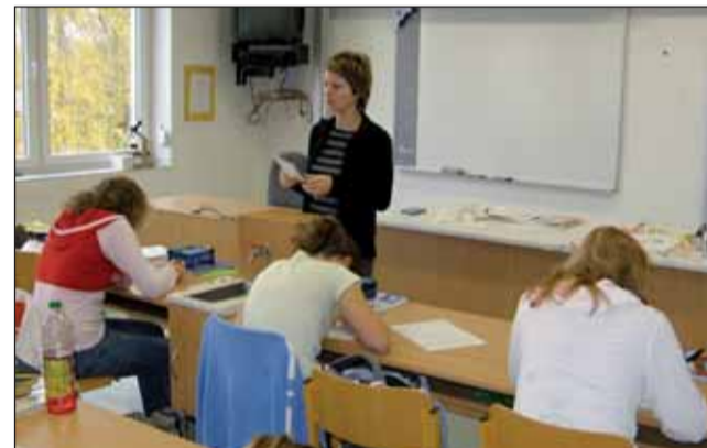
Výuka. Interaktivní tabule slouží žákům vyššího stupně, menší se dočkají v příštím roce.