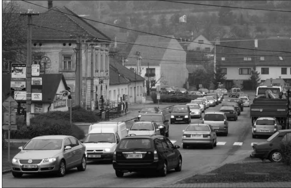
Doprava. Tisíce vozidel „zaplavily“ o víkendu Lysice.