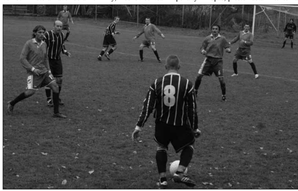
Kolo remíz. Ve znamení nerozhodných výsledků bylo víkendové kolo okresního přeboru. Remízou skončil i zápas Doubravice s boskovickým béčkem.

V Doubravici se na těžkém terénu hrál vcelku solidní zápas. Domáci brankář udělal chybu ve 25. minutě a Pavel dorazil.