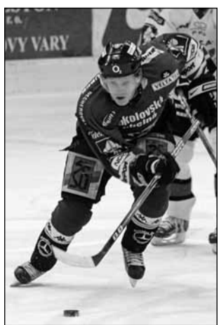
Narozen: 1. 4. 1988. Výška: 179 cm. Váha: 81 kg. Post: útočník.