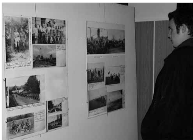
Legionáři. Desítky fotografií a dalších dokumentů přibližují život legionářů za 1. světové války.

Na výstavě jsou k vidění dobové fotografie a dokumenty, mimo jiné také koresponden-