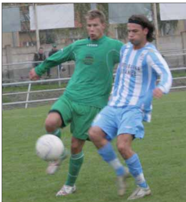
Souboj. V první půli sehráli Rájec i se Šardicemi vcelku vyrovnaný souboj. Pak se favorit prosadil.

Boskovice/Rájec-Jestřebí – Na oba celky z našeho regionu čekaly o víkendu těžcí protivníci. Prognózy se bohužel potvrdily. Boskovice i Rájec neprokročily svůj stín a odevzdaly všechny body.