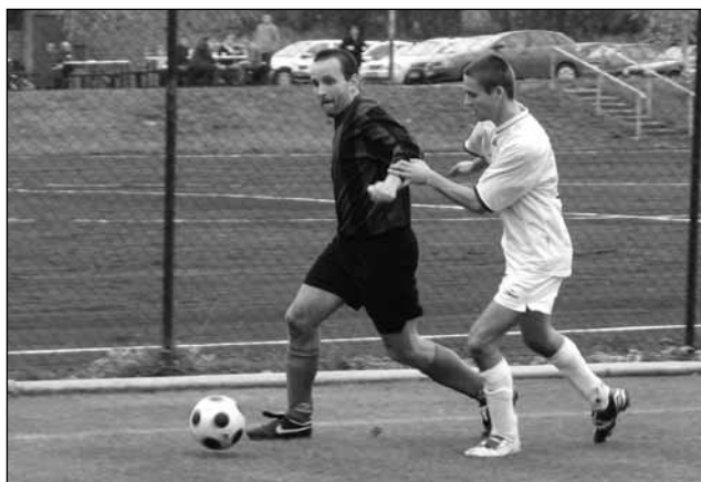
Náskok. Fotbalisté Bořitova po výhře nad Jedovnicemi získali na čele tabulky již sedmibodový náskok.

Boskovice B – Kotvrdovice 6:1 (3:0), Bárta, Pavel 2, Peš, Zoubek – Hloušek P.