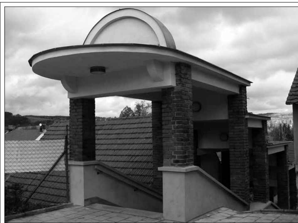
Fortna. V měsíci říjnu ve Svitávce dokončili opravu schodů ke kostelu. Nový kabát dostaly omítky a rekonstrukci prošlo i osvětlení. Po stranách fortny bylo zabudováno zábradlí. (bh)

Motocykl s objemem válců motoru do 350 ccm 20 Kč, nad 350 ccm 30 Kč, auto s objemem do 1850 ccm 50 Kč, nad 1850 ccm 70 Kč, autobus 160 Kč, nákladní automobil do 12 tun nebo přípojné vozidlo nad 3,5 do 10 tun 130 Kč, nákladní automobil na 12 tun nebo přípojné vozidlo nad 10 tun 300 Kč, speciální vozidlo 80 Kč, přípojné vozidlo do 3,5 tuny 30 Kč, zemědělský nebo lesnický traktor a jejich přípojné vozidlo 40 Kč, ostatní vozidla 60 Kč.