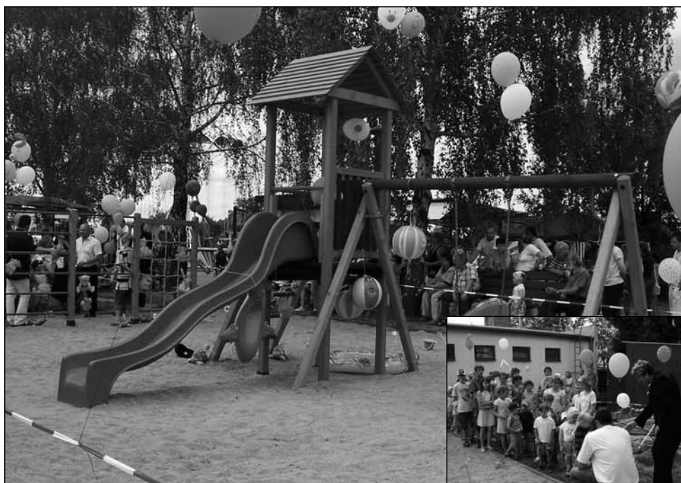
Pro děti. Už od loňského roku mají na Oboře nové dětské hřiště. Letos oslavili první rok jeho otevření.

od letošního roku pochlibit hasičská zásahová jednotka obce. „Novým i úvozovkách. Koupili jsme je totiž starší od dobrovolných hasičů z Maršova. Pořízení včetně opravy a pře-