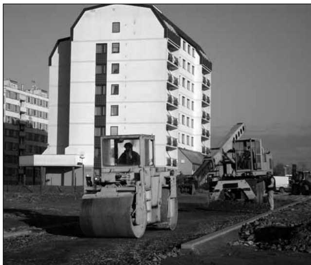
Nová silnice. V rámci revitalizace sídliště Písečná se momentálně pracuje na vybudování nové komunikace.

Zhruba čtyři miliony korun putují na Písečnou, kde na podzim začala další etapa revitalizace tohoto trochu zanedbaného sídliště. Ta bude ve finále stát kolem patnácti milionů.