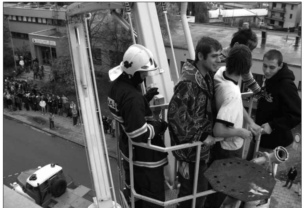
Evakuace. Někteří studenti si vyzkoušeli také jízdu na vysokozdvizné plošině.

Jak dále řekl, hasiči měli strach, že jim nasazení plošiny zhatí hlášený nárazový vln až sedmdesát metrů za vteřinu. Plošina totiž může zasahovat