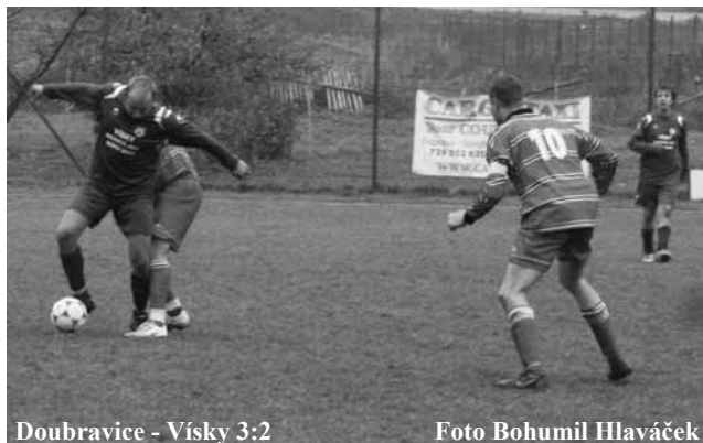
Doubravice - Visky 3:2

Domáci se trochu zlobili, když ve strkanici po čtvrt hodině hry nepiskal sudí útočný faul. Nezůstalo u toho, ze závaru padl i vedoucí gól Letovic. Zápas bez štávy se hrál v podobném duchu dál. O konečném výsledku se rozhodlo zno-