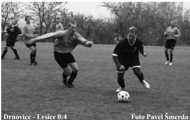
Drnovice - Lysice 0:4

Po bezbrankovém prvním poločase se v derby po změně stran nestačili domácí divit. Lysice je přehrály po všech stránkách, navíc přidaly čtyři krásné góly. Nejprve neproměnil pokutový kop za sražení Ostrého Měcháček. Hosty to nesložilo do kolen a dál hráli svoji hru. A odměna