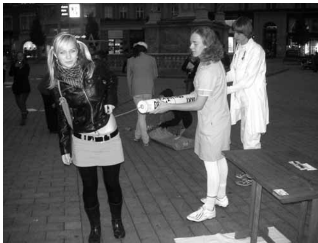
Akce. Devátáci z Kunštátu při svém vystoupení na happeningu na náměstí Svobody v Brně.

„Chceme rozšířit povědomí o chudobě, o jejích rozličných podobách, o nástrojích boje s chudobou a o tom, jak souvisí s životem nás všech v České republice. Chceme z chudoby učinit samozřejmé téma čes-