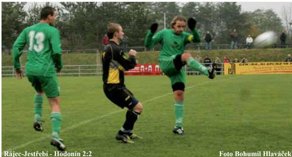
Rájec-Jestřebí - Hodonín 2:2

Příští kolo: Hodonín - Rájčko, Tasovice - Bavorsy, Bohunice - Kuřim, Sparta - Ratiškovice, Kyjov - Židenice, Ivančice - Znojmo B, Velká n/V - Moravský Krumlov, Rájec-Jestřebí - Hrušky.