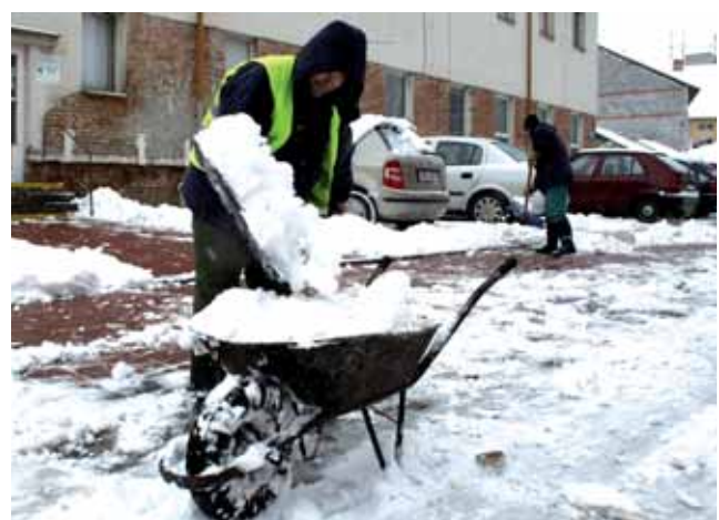
Úklid. Vedení boskovické radnice bude žádat občany, aby si před svými domy uklidili sníh.

„Vybrali jsme chodníky, které nebudou udržovány. Respektujeme chodníkovou novelu, ale příliš velkou radost z ní nemáme. Budeme uklízet jen páteřní cesty ve městě. To znamená takové, které vedou například na zastávky hromadné dopravy, ke