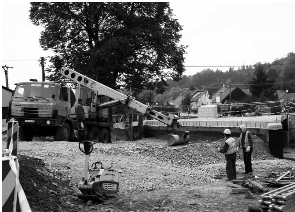
Doprava. Silnice mezi Bořitovem a Rájcem-Jestřebí je po měsíční pauze zase průjezdná. Momentálně se ještě pracuje na dvou mostech.

Co pokračování silnice Blansko – Boskovice, obchvat Rájčeka?