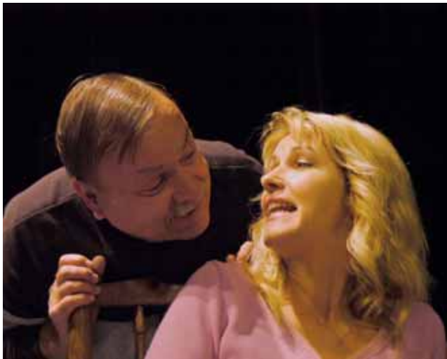
Divadlo. Zítra představí blanensští ochotníci v Dělnickém domě svoji hru Garderobiér. Začátek je v 19.30 hod.

Hraje ho Vladimír Vrtěl a Garderobiéra, který je titulní postavou, Radomír Kincl. „Osvědčení známí blanensští