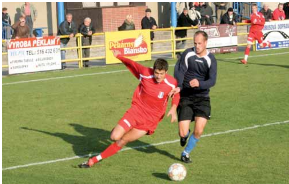
Porážka. Blansko podalo v posledním letošním domácím představení ostudný výkon a podleho průměrné Konici 0:2.

Ani poločasová přestávka Blanenské neprobudila a jejich trápení pokračovalo. Trest byl zákonitý. V 58. minutě přišel zmatek v domácím vápně a s trochou štěstí skončil míč v síti nešťastného nevinného Slaniny - 0:2 . Všem bylo jasné, že je rozhodnuto. A bylo tomu tak. Blansko spod deky nevykouklo ani ve zbytku utkání. Až trapně působil pokus Bednáře