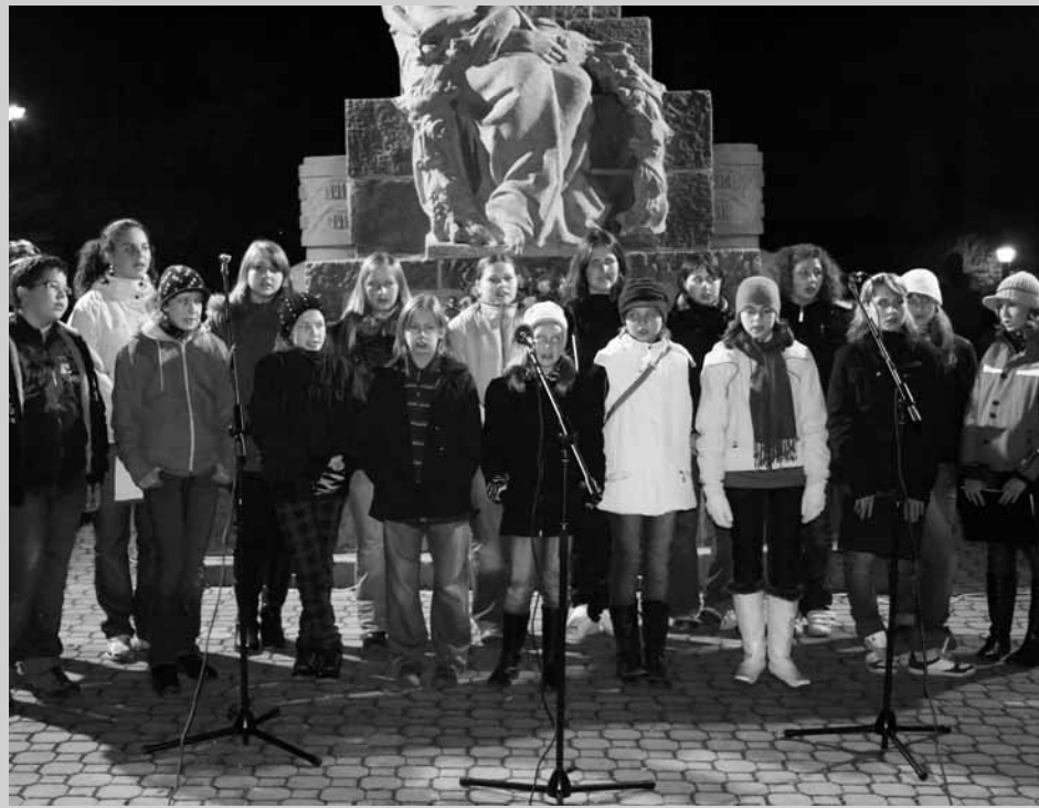
Oslava. V předvečer státního svátku vzniku samostatné československé republiky uspořádali v Lysicích lampiónový průvod, který byl spojený s kladením věnce k pomníku na náměstí Osvobození. Děti dostaly zdarma lampióny, při akci zahrála dechová hudba pod taktovkou pana Sehnala, vystoupily tradičně i děti ze základní školy.