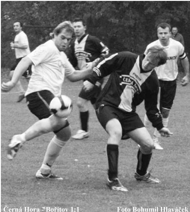
Černá Hora - Bořítov 1:1