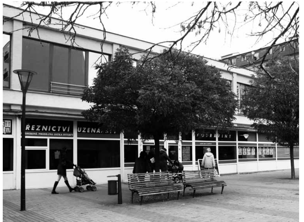
Wanklovo náměstí. Prostory masny jsou již prázdné, obchod s potravinami by měl skončit podle majitelky objektu k poslednímu prosinci letošního roku.

Majitelkou nemovitosti je Yveta Hlaváčová. „Drogerie naše podmínky i požadavky na budoucí podobu objektů splňu-